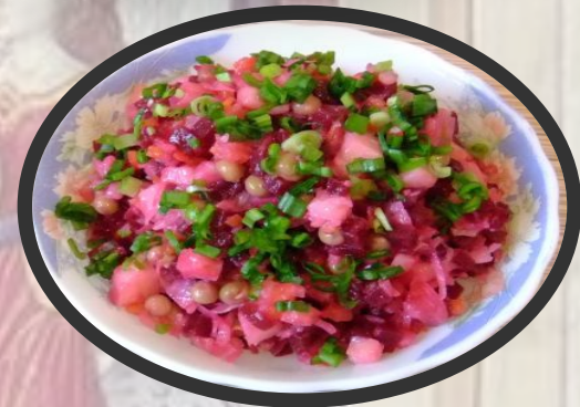
салаты и винегреты