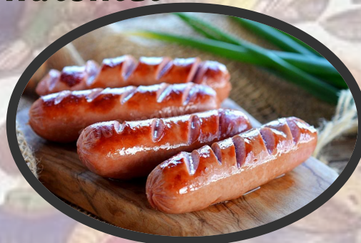
сосиски и сардельки