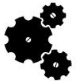
Разработка Технической Документации