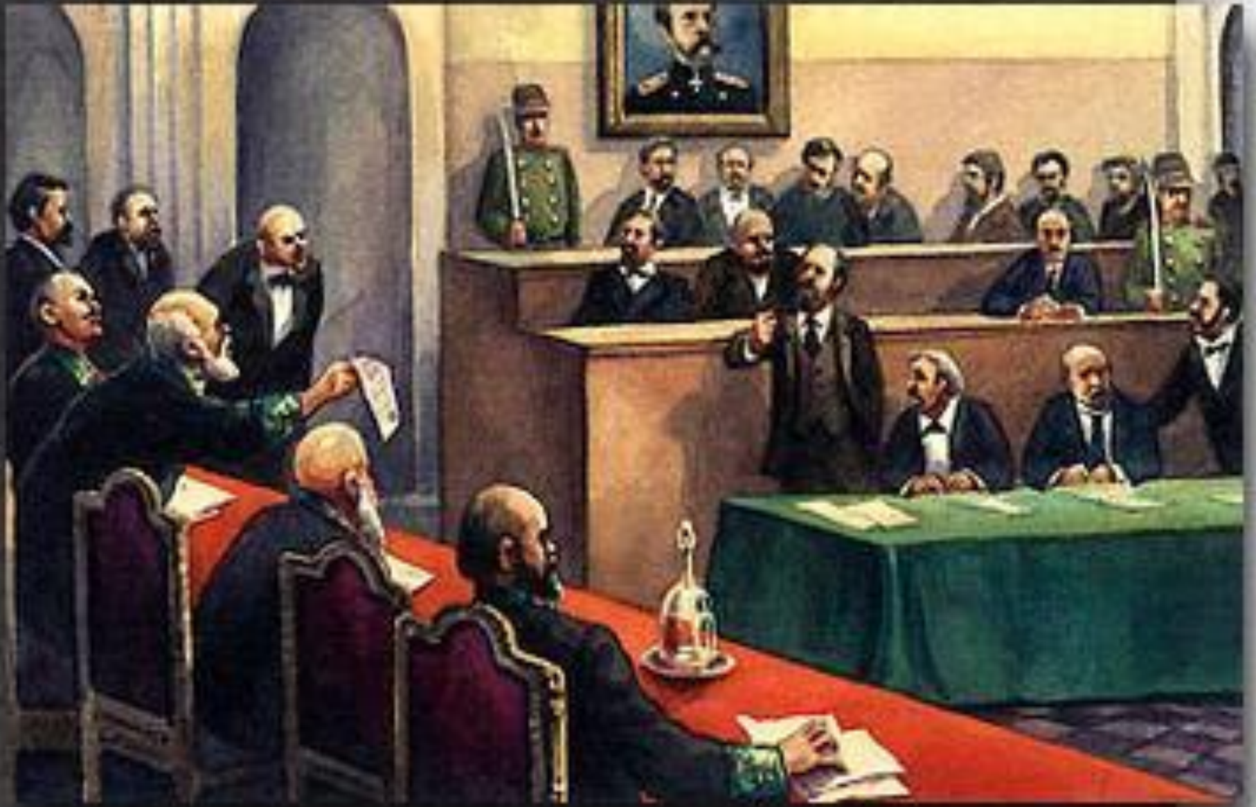
Заседание нового суда с присяжными заседателями