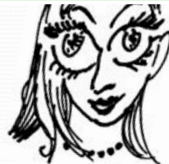
Делать большие глаза