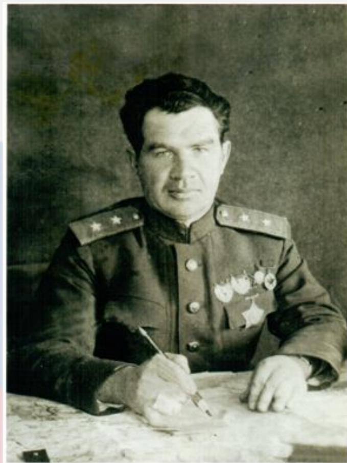
В. И. Чуйков Январь 1943 г

«...Казалось, что всё живое должно было погибнуть среди этого моря огня, среди непрекращающихся бомбёжек, что человеческие нервы больше не способны выдержать этого адского напряжения. Но воины выдержали. Несокрушимой стеной стояли они на своих рубежах...»