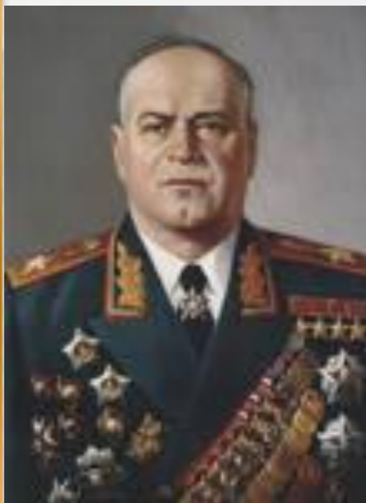
Г. К. Жуков