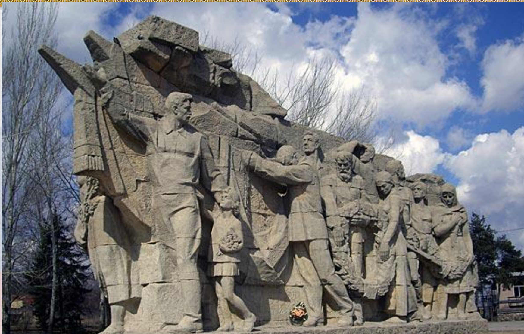
У ВХОДА НА МАМАЕВ КУРГАН. СКУЛЬПТУРА «ПАМЯТЬ ПОКОЛЕНИЙ».