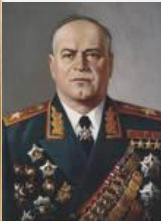
Г. К. Жуков