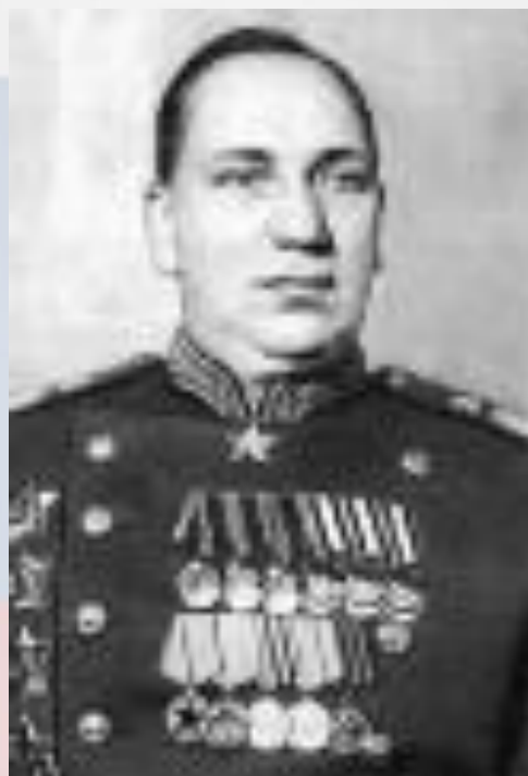
Н. Н. Воронов