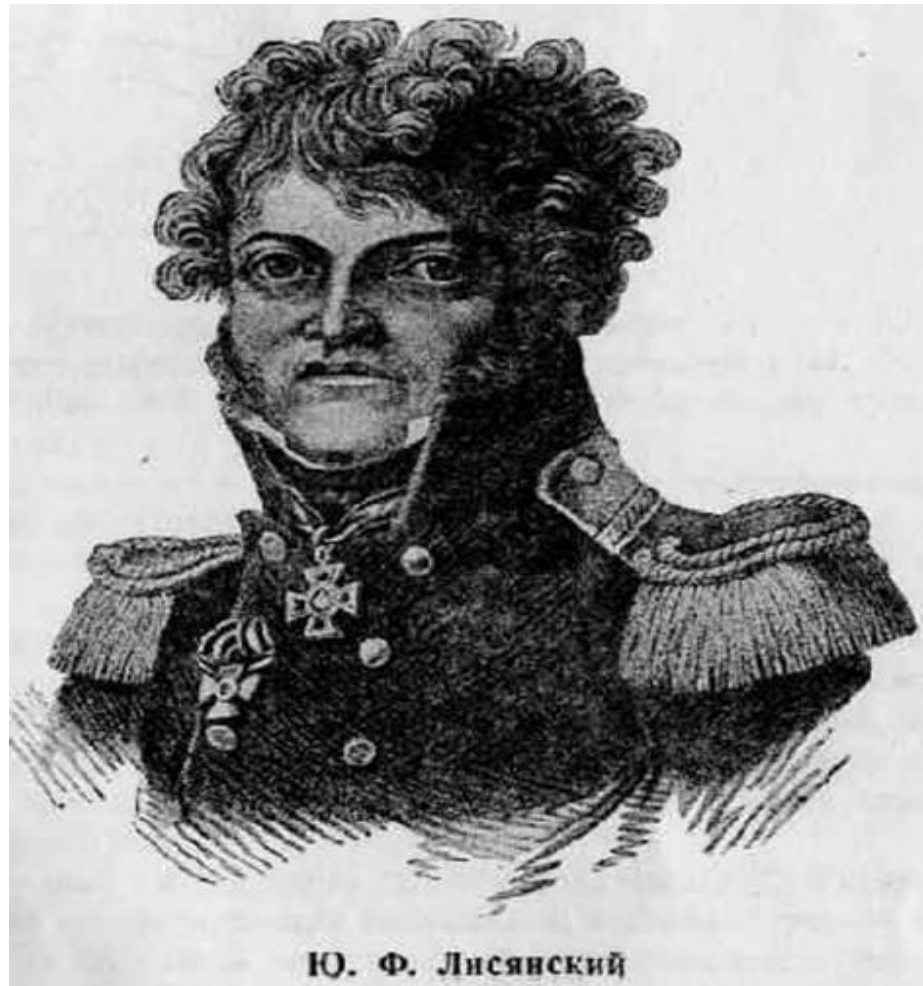
Ю. Ф. Лисянский