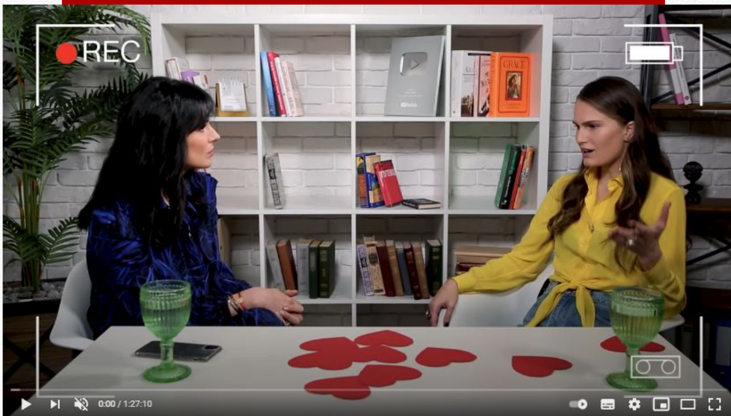
Алла Костромичева о кризисе в отношениях с мужем, анорексии и крымском детстве