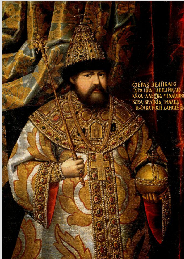
Портрет царя Алексея Михайловича. Неизвестный художник. XVII в. Государственный исторический музей.