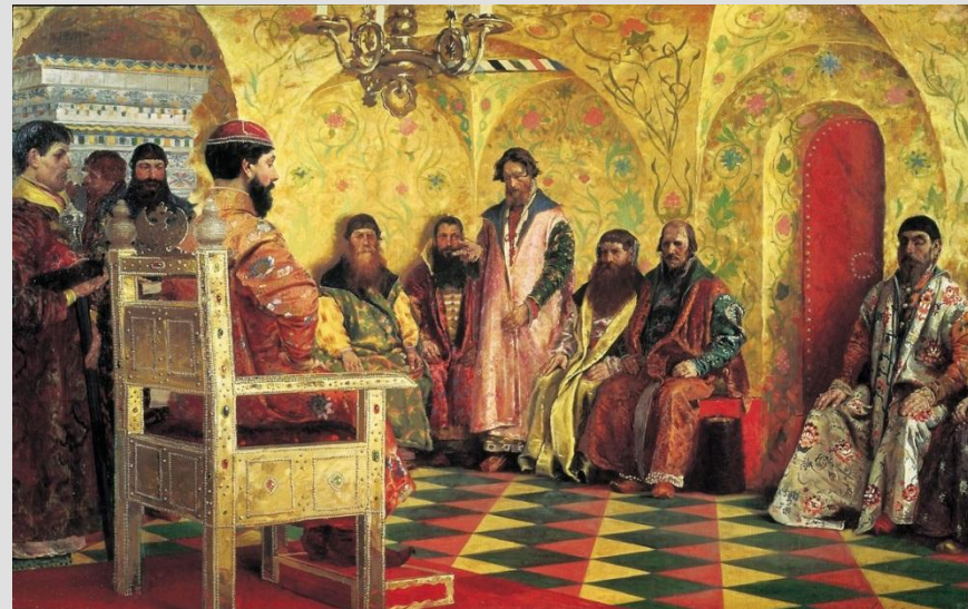
Сидение царя Михаила Фёдоровича с боярами в его государевой комнате. А.П. Рябушкин. 1893 г.

В XVII в. власть московских государей считалась неограниченной. Однако в реальной жизни существовали факторы, которые ограничивали ее: представления об участии «земли» в управлении государством, значительная роль боярства в политической жизни страны и нехватка таких институтов, которые бы позволяли монарху контролировать общество.