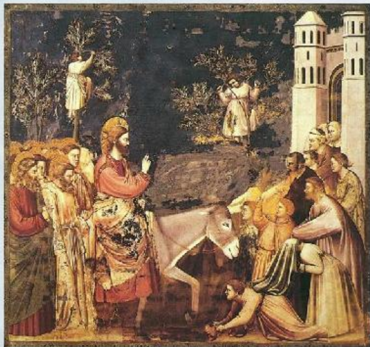
Джотто. Вход Господень в Иерусалим

Согласно Библии, В ЭТОТ день Иисус на молодом осле – символе кротости и миролюбия – торжественно въехал в ворота Иерусалима.