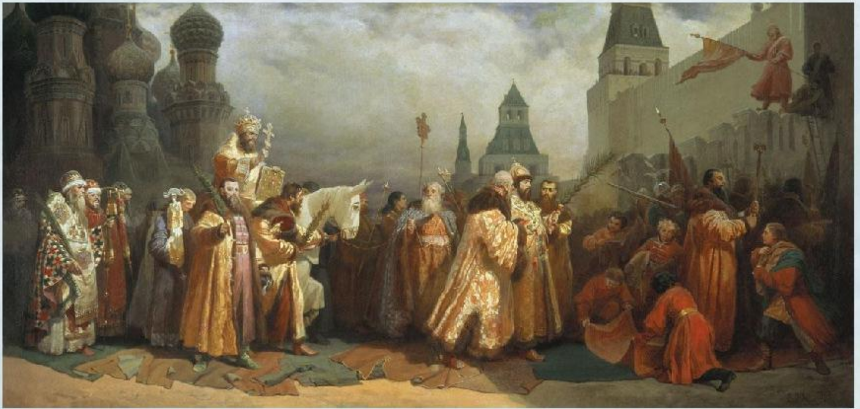
В. Г. Шварц «Шествие на осляти Алексея Михайловича» 1865.

На Руси в праздник Входа Господня в Иерусалим совершалось так называемое «шествие на осляти».