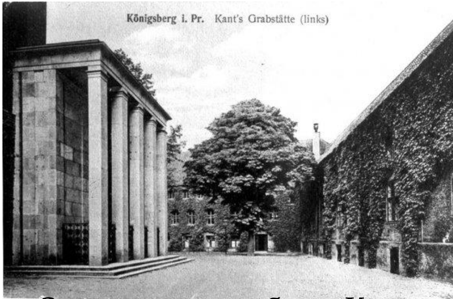
Здесь учился и работал Кант