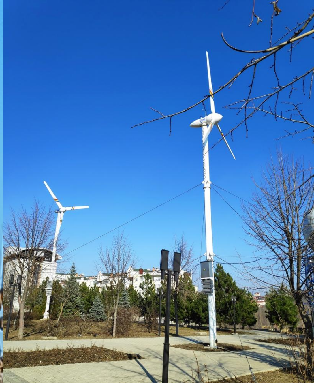
Преимущество №5 – Установки по добыванию ветровой и солнечной электроэнергии