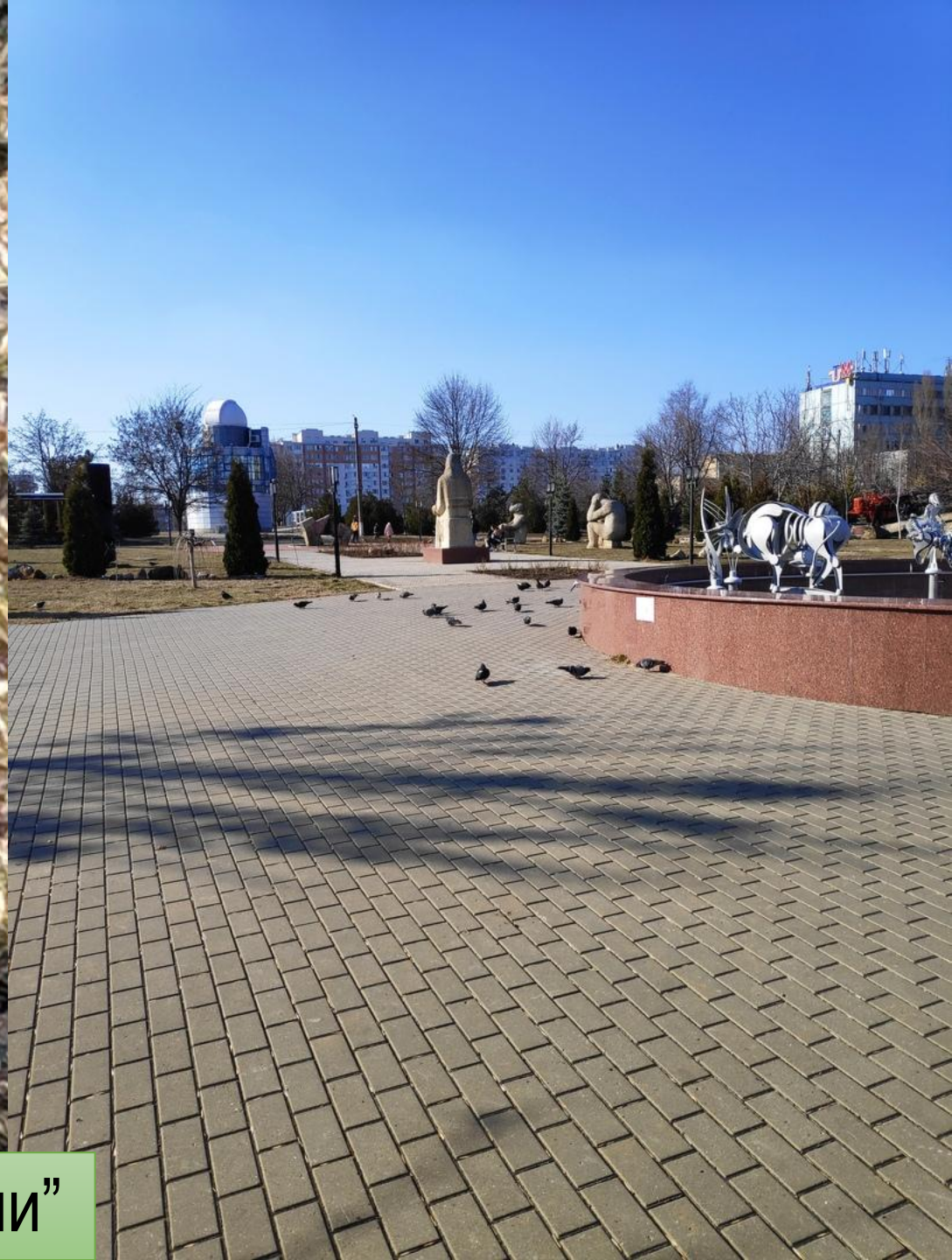
Фауна представлена лишь “Сизыми голубями”