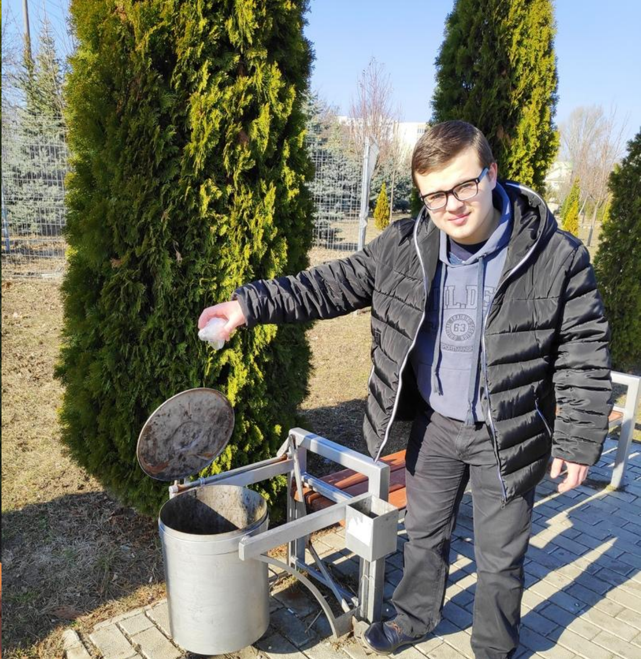
Преимущество №4 – Оснащение парка удобными мусорными баками