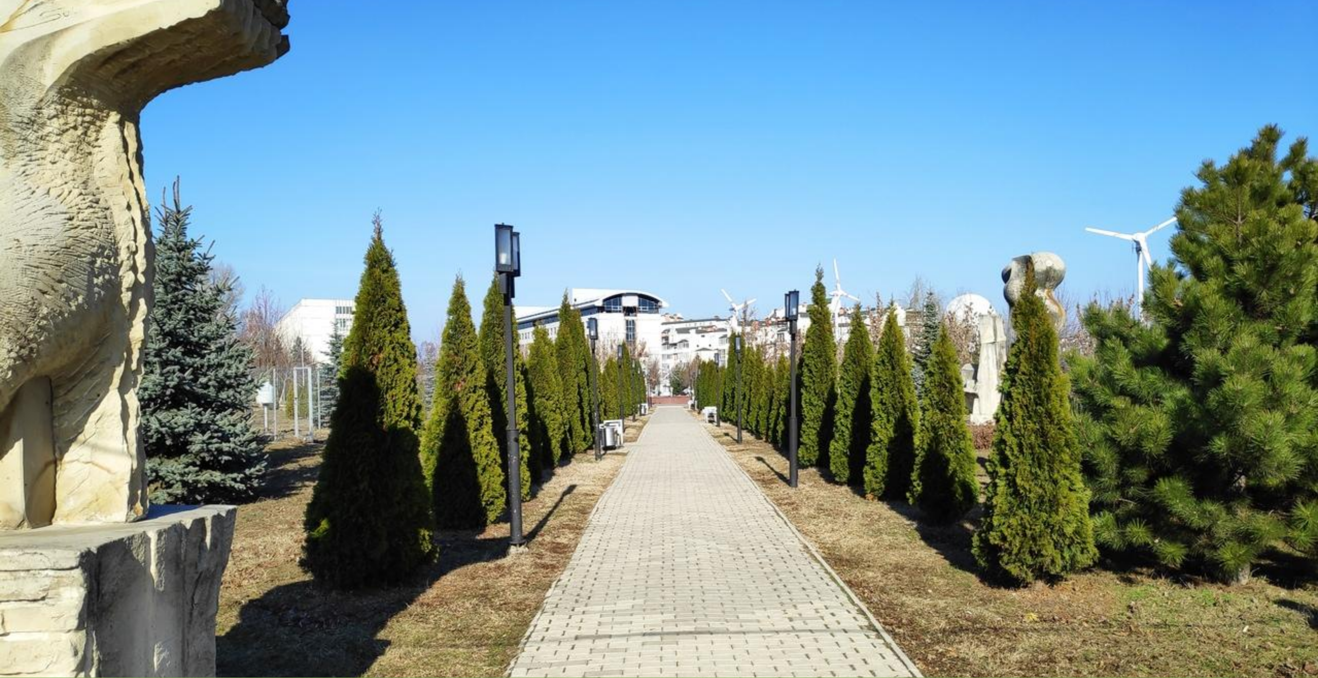
Вывод – парк находится в отличном состоянии и приятен для прогулок