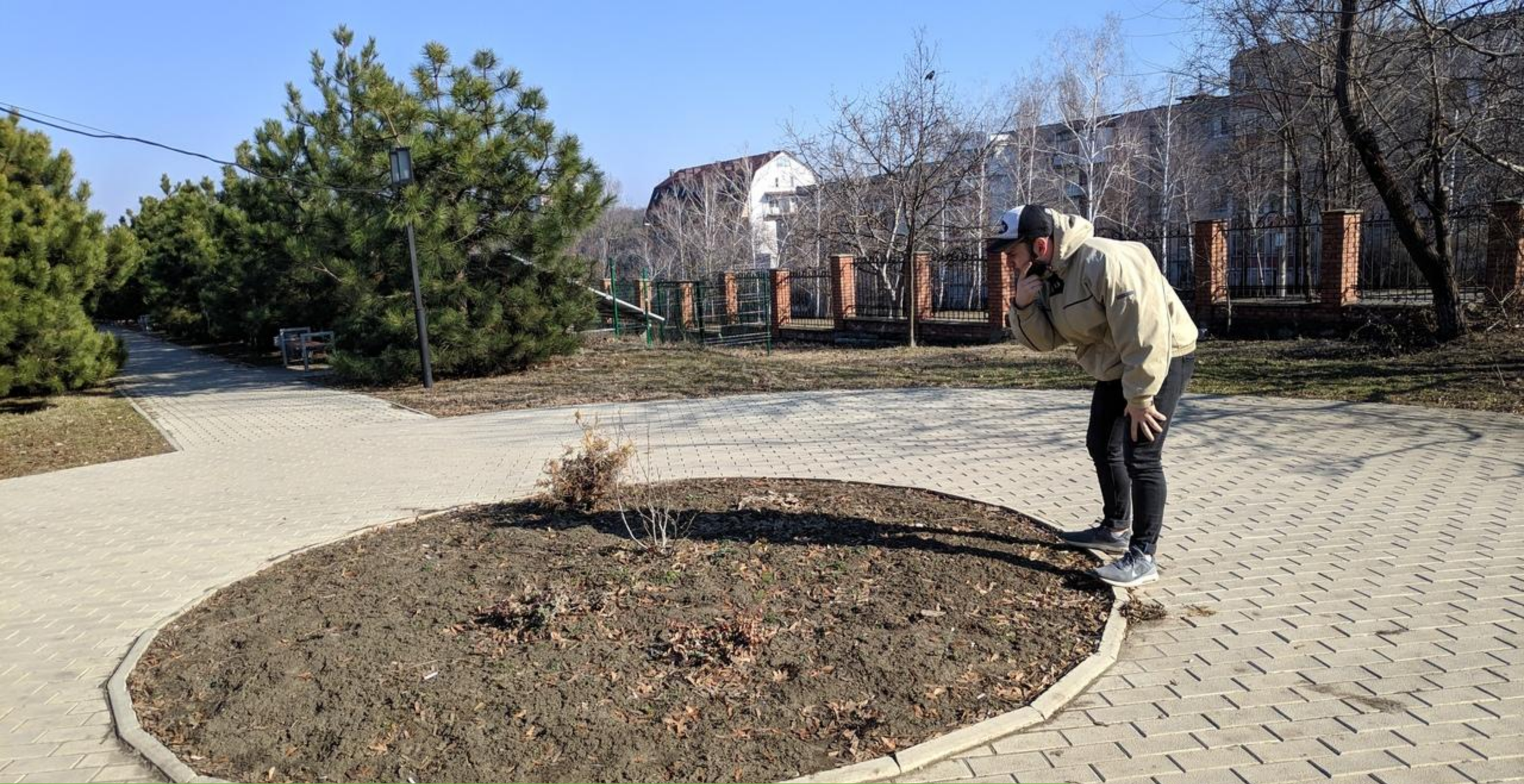
Преимущество №3 – Насаждения молодых растений