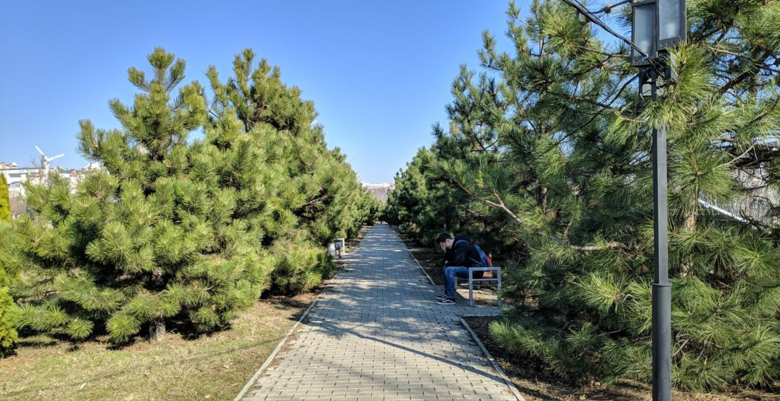
Преимущество №1 – Уход за местной растительностью