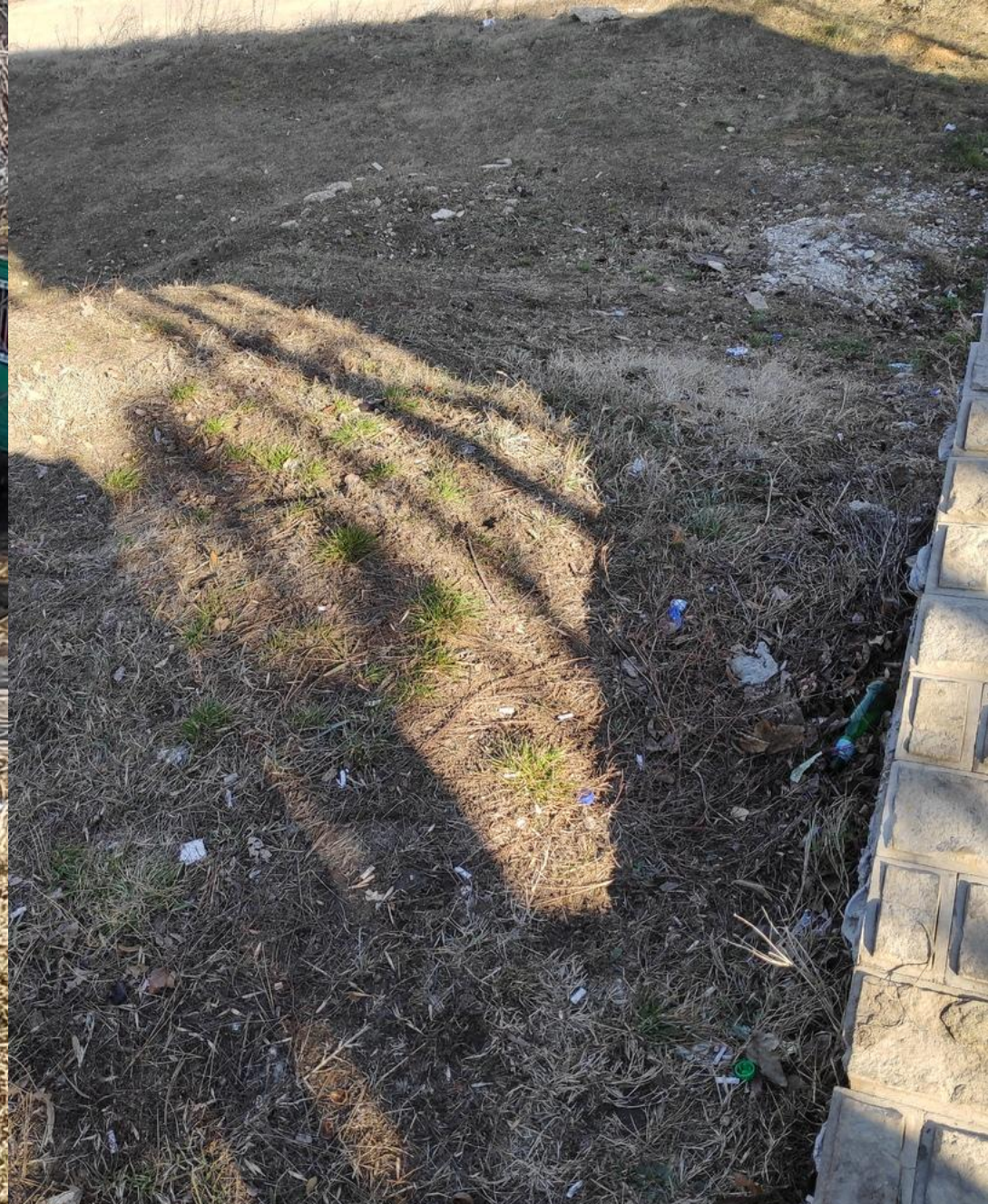
Недостаток №1 – Сразу же за пределами парка находятся большие скопления мусора