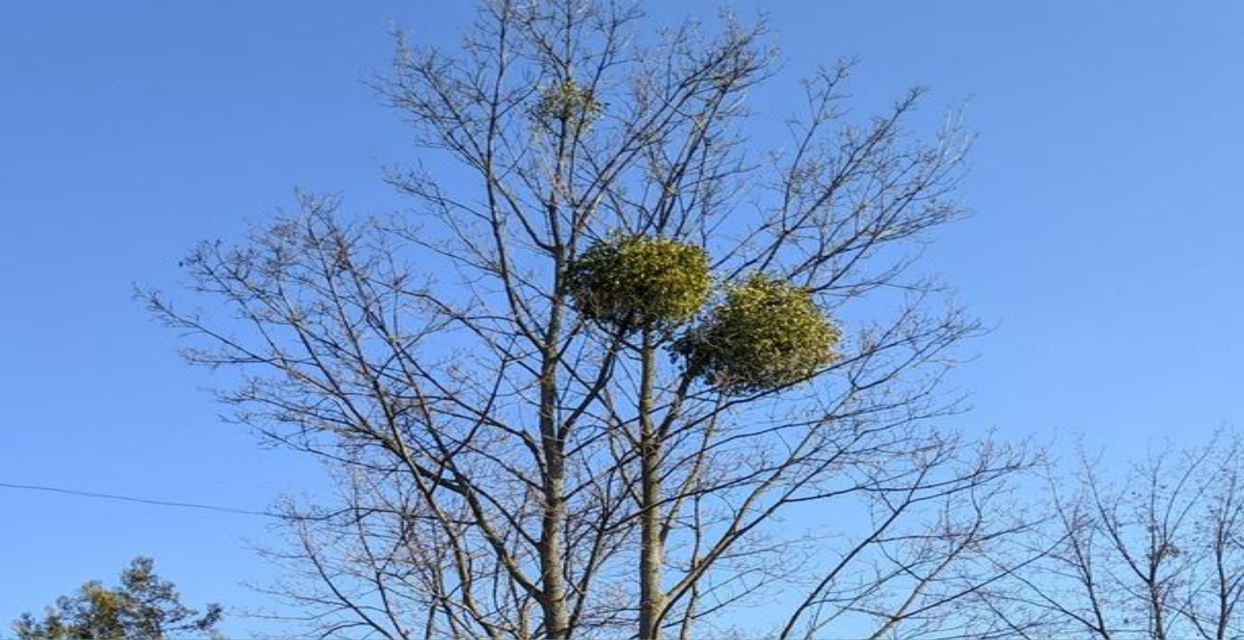
Недостаток №2 – На деревьях присутствуют полупаразиты “Омелы белые”