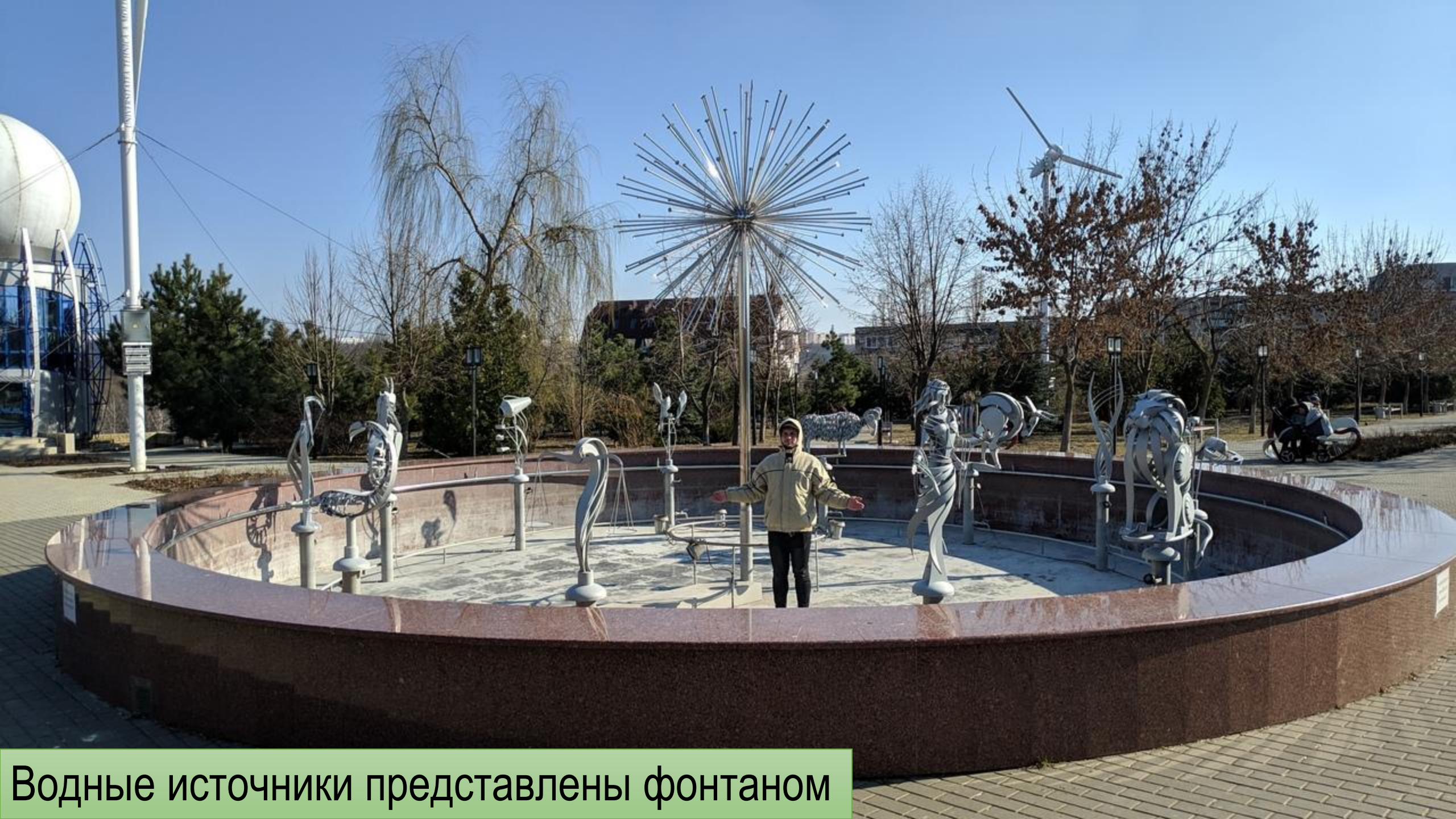
Водные источники представлены фонтаном