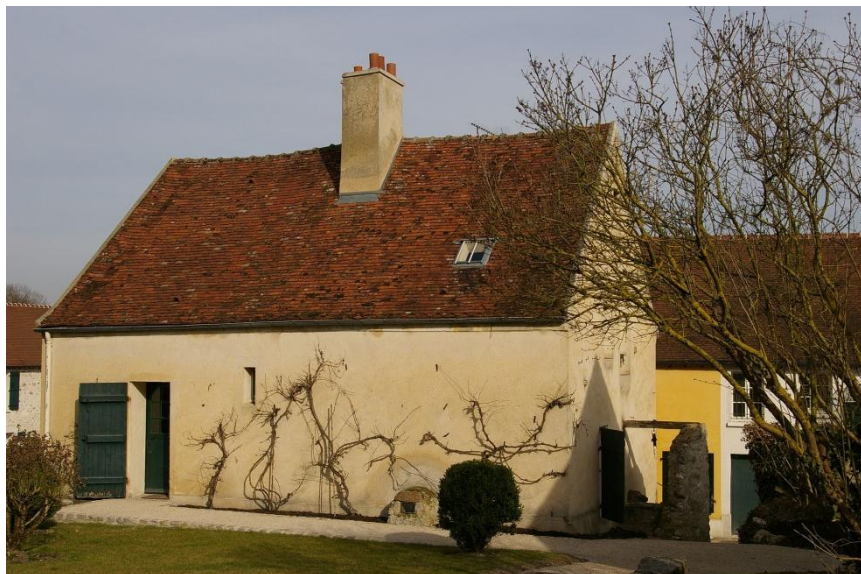
Место рождения Луи Брайля в городке Кувре (Франция).

Луи Брайль родился 4 января 1809 года в семье сапожника Симона-Рене (Simon-René) Брайля в небольшом французском городке Кувре. В 3-летнем возрасте Брайль начал слепнуть в результате воспаления глаз, начавшегося оттого, что мальчик поранился шорным ножом (подобие шила) в мастерской отца, окончательно он ослеп в 5 лет. Родители научили Луи плести бахрому для конской упряжи, шить домашние туфли, пригласили учителя музыки для обучения Луи игре на скрипке. Алфавит Луи изучал в местной школе при помощи палочек.