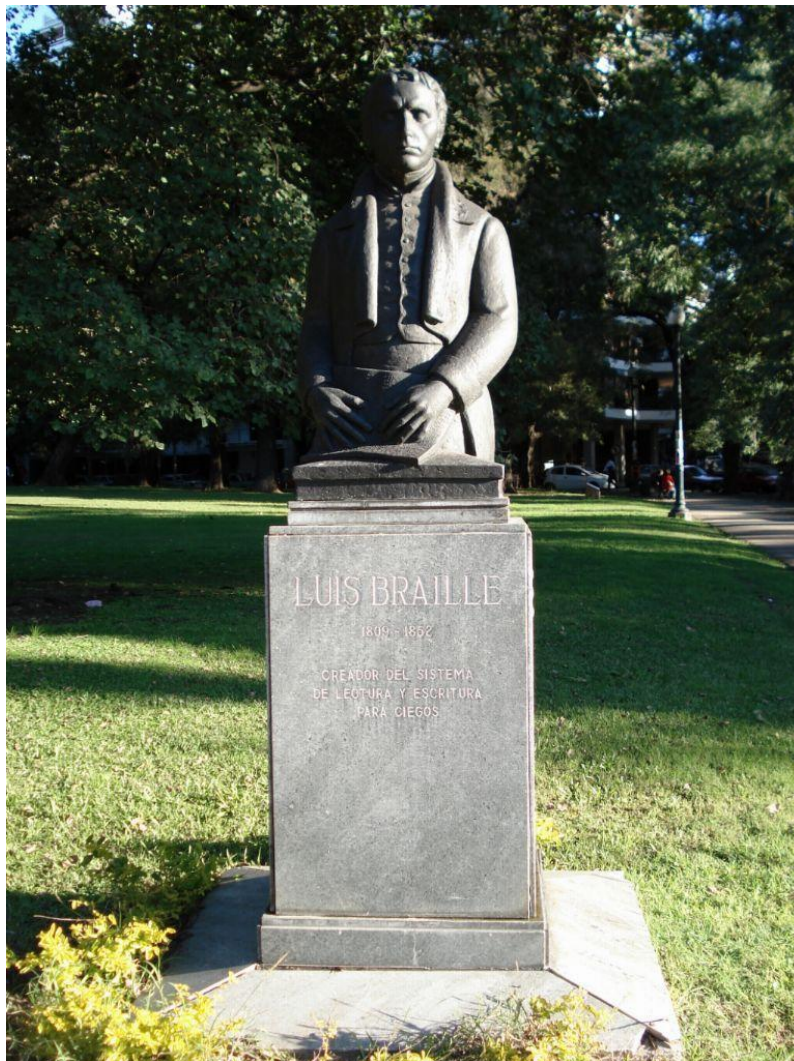
Бюст в Буэнос-Айресе.

Брайль был талантливым музыкантом, преподавал музыку незрячим и слабовидящим людям, на основе принципов, положенных в основу его шрифта, разработал шрифт для записи нот (нотопись).