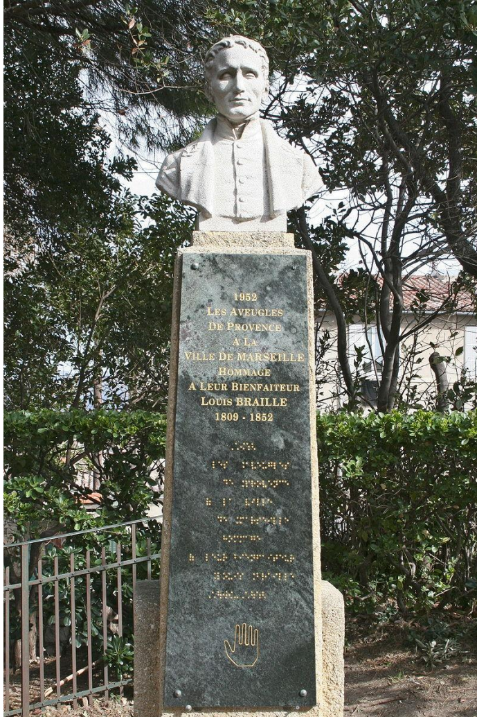
Бюст в Марселе.

В 1824 году (в 15 лет) Брайль разработал рельефно-точечный шрифт для незрячих и слабовидящих людей, названный в его честь шрифт Брайля и используемый по сей день во всём мире. Брайль работал над шрифтом многие годы и в 1829 году представил начальный вариант шрифта на рассмотрение совета института. Совет института счёл шрифт неудобным для зрячих преподавателей, и только в 1837 году по настоянию слепых и слабовидящих людей совет института снова вернулся к рассмотрению шрифта.