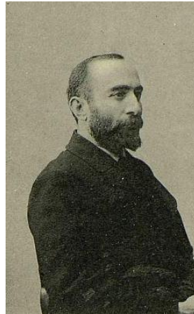
Н.С. Чхеидзе 1864–1926 гг.