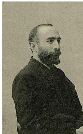
Н.С. Чхеидзе 1864–1926 гг.