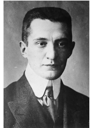
А.Ф. Керенский 1881–1970 гг.