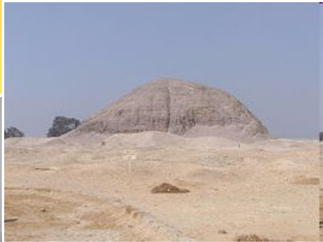
Пирамида в Хаваре