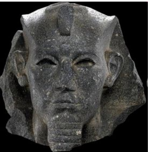
Голова колосса Аменемхета III, найденного в храме Бастет. Гранит. Британский музей