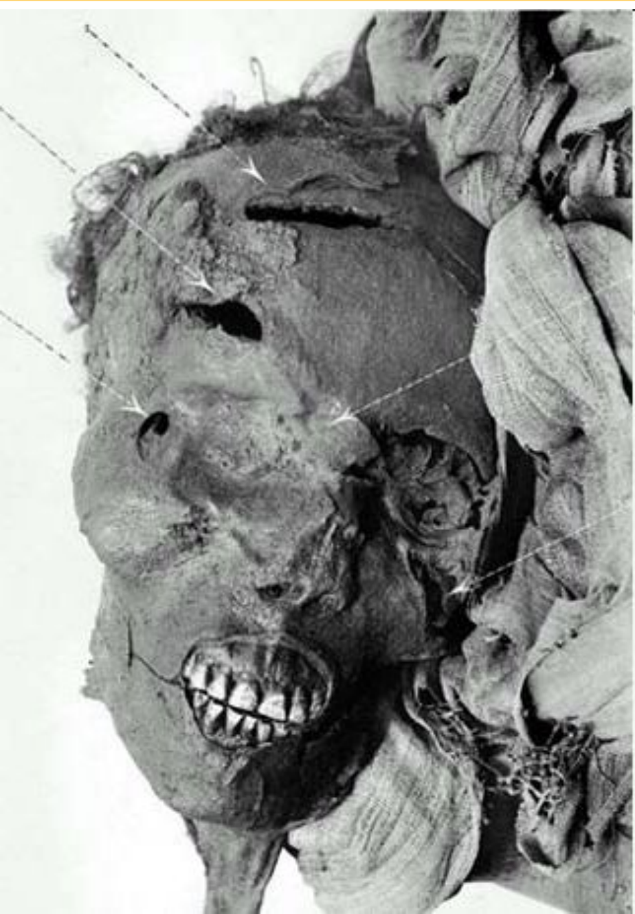
Мумия Секененра Тао II Следы насильственной смерти