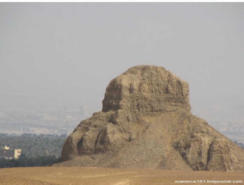
«Темная пирамида» Аменемхета III в