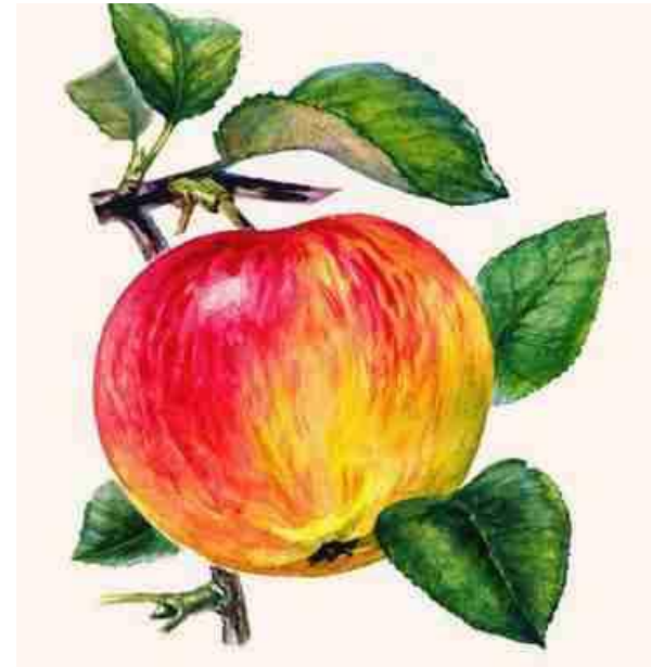
Плод – часть растения

Плот - скрепленные в несколько брёвен для сплава по реке