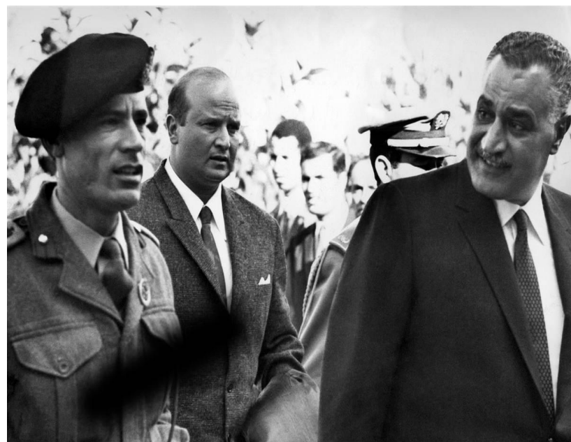
Президент Египта Г. А. Насер