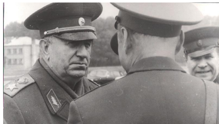
генерал-лейтенант П.Ф. Батицкий.