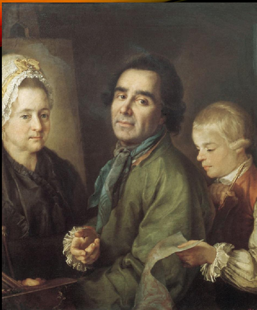
«Портрет А.П. Антропова с сыном перед портретом жены Елены Васильевны»