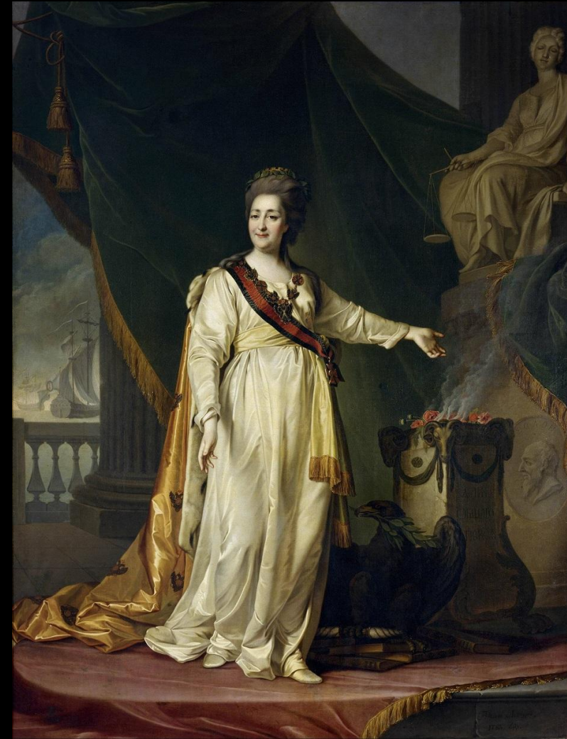
Дмитрий Левицкий. «Портрет Екатерины II в виде Законодательницы в храме богини Правосудия»