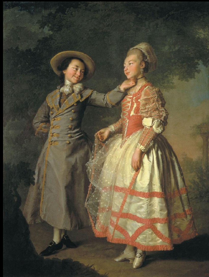
Дмитрий Левицкий. «Е. Н. Хруцова и Е. Н. Хованская»