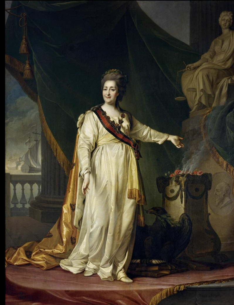
Дмитрий Левицкий. «Портрет Екатерины II в виде Законодательницы в храме богини Правосудия»