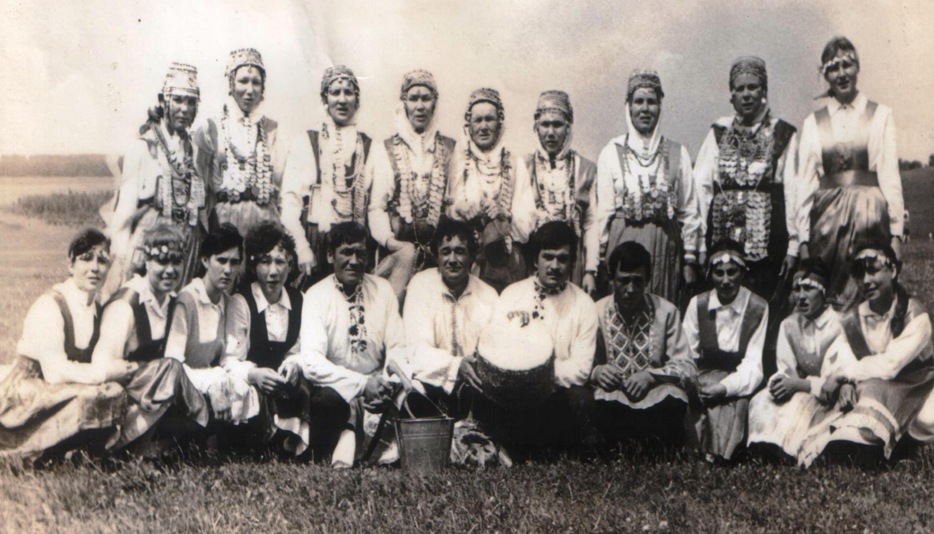
Коллектив художественной самодеятельности Хыркасинского клуба. 1985г.