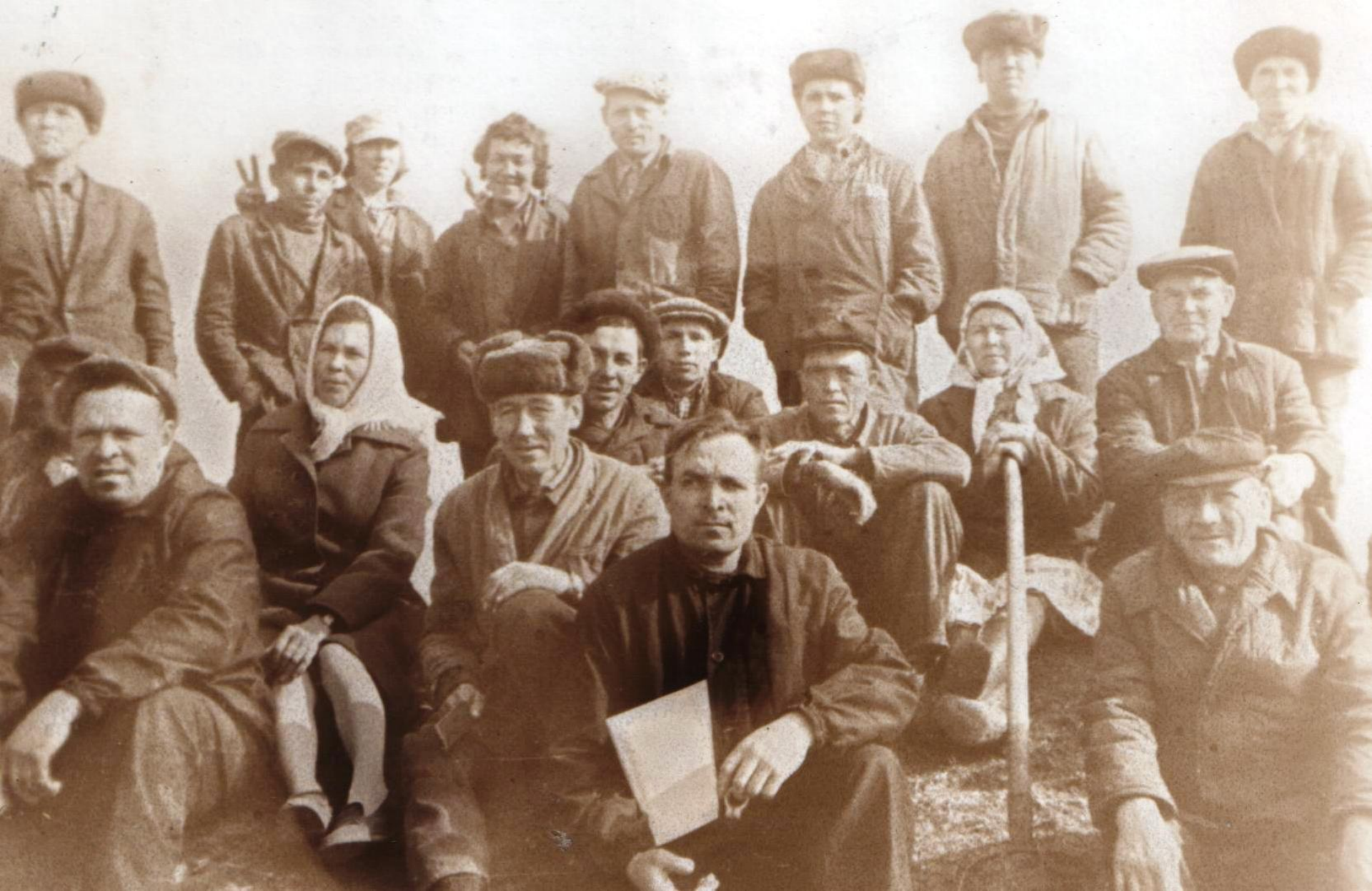
4-ая бригада совхоза «Богатырь» (д. В. Хыркасы)