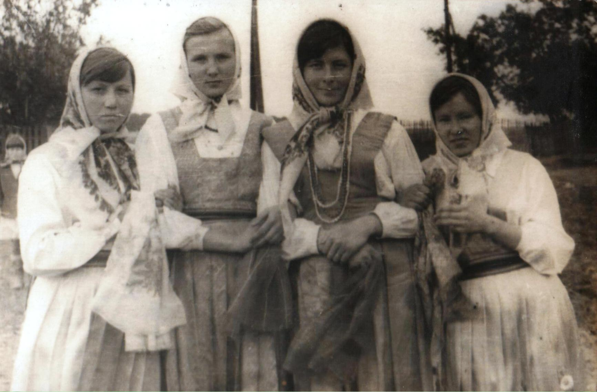
Девчата на праздновании св. Троицы. 1978г.