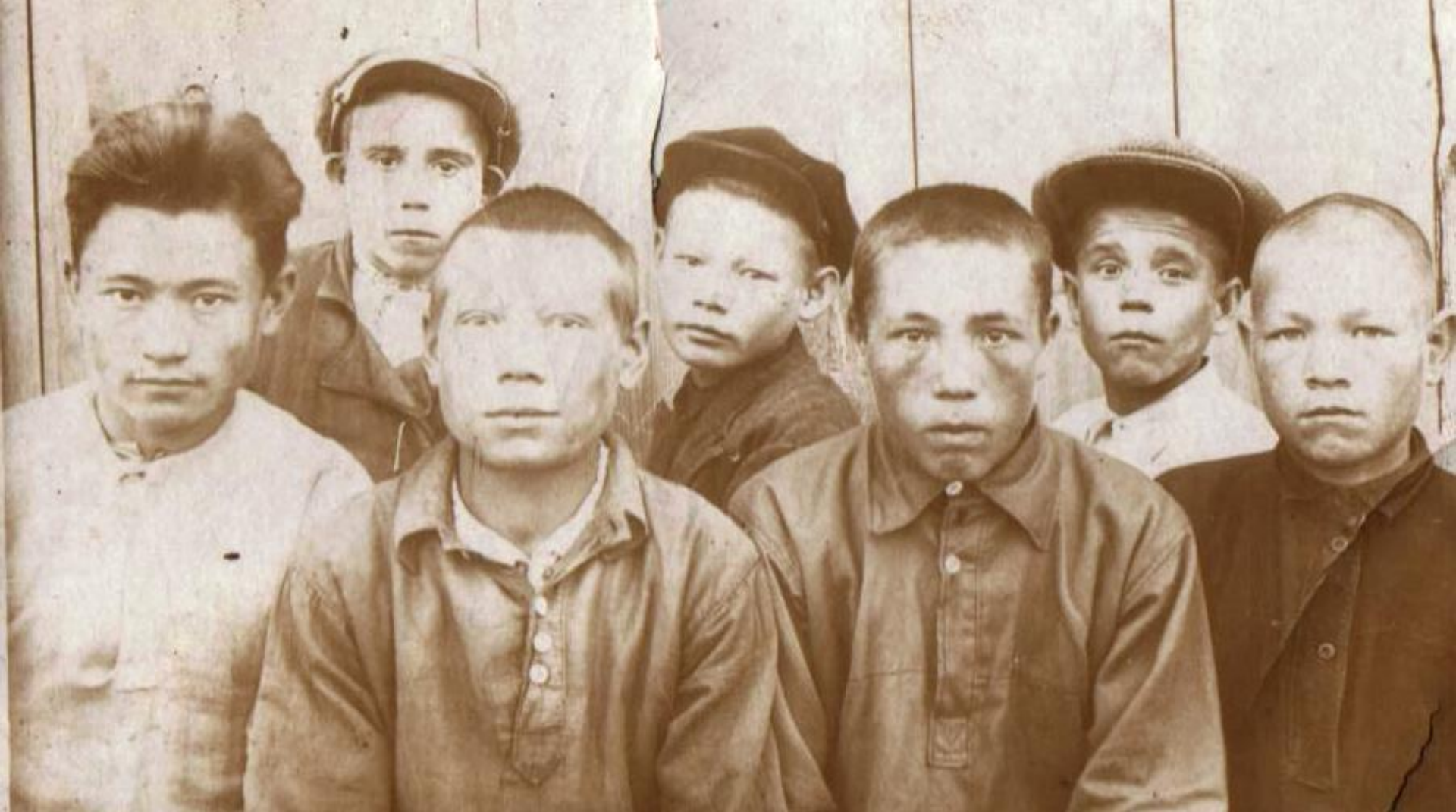
Молодежь деревни Верхние Хыркасы 1934г.