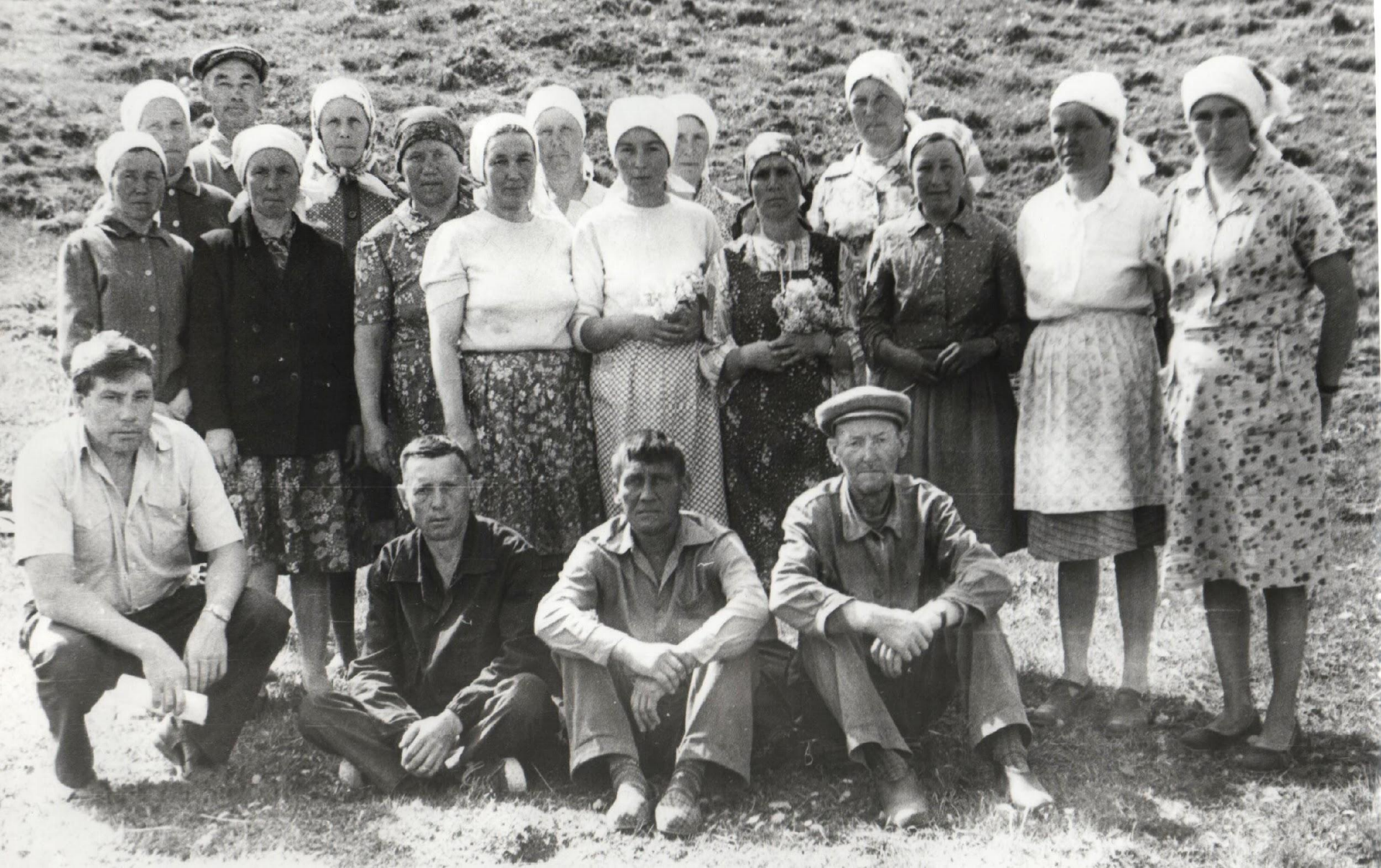
4-ая бригада совхоза «Богатырь» (д. В. Хыркасы)