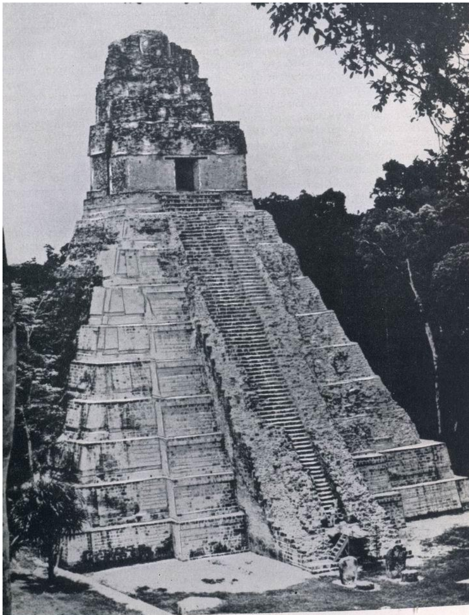
Храм I, Тикаль. Вид после раскопок