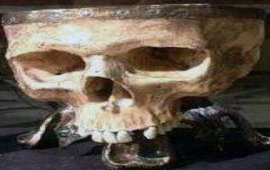
КЕНЕСАРЫ ХАН КАСЫМОВ последний раб-одник царской России 1837-1847 гг.