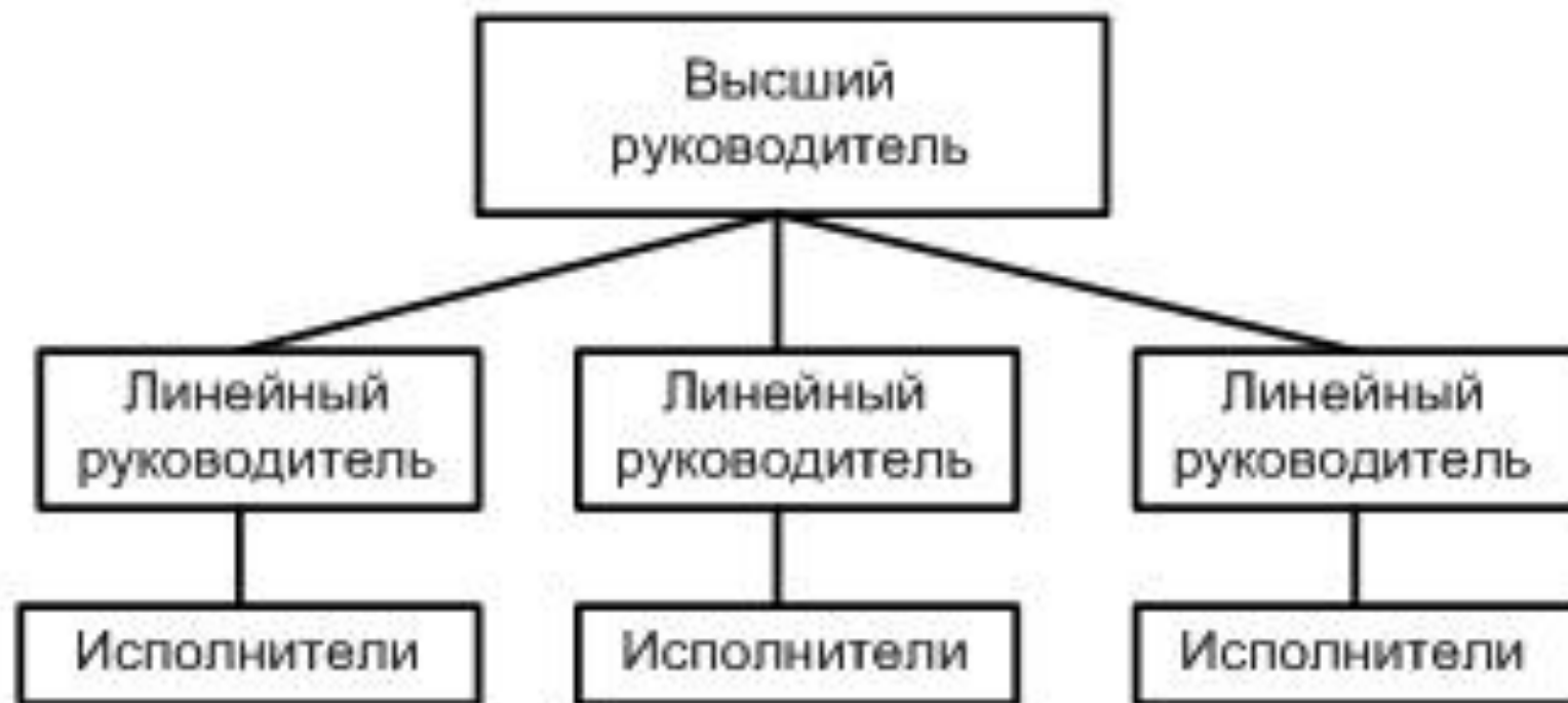
Рис. 1 Линейная структура управления