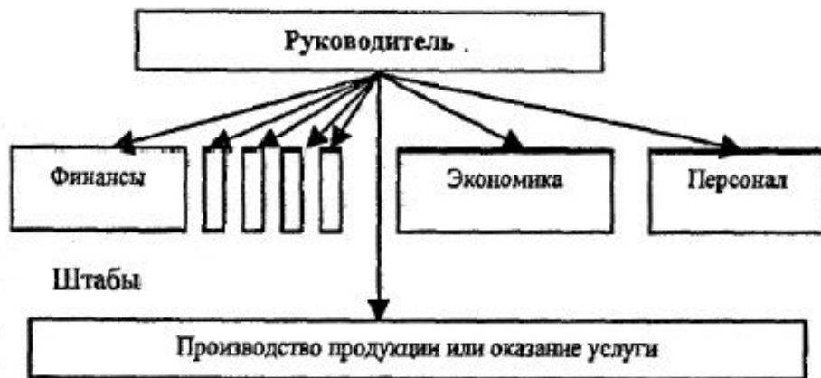
Рис. 3 Линейно-штабная структура управления