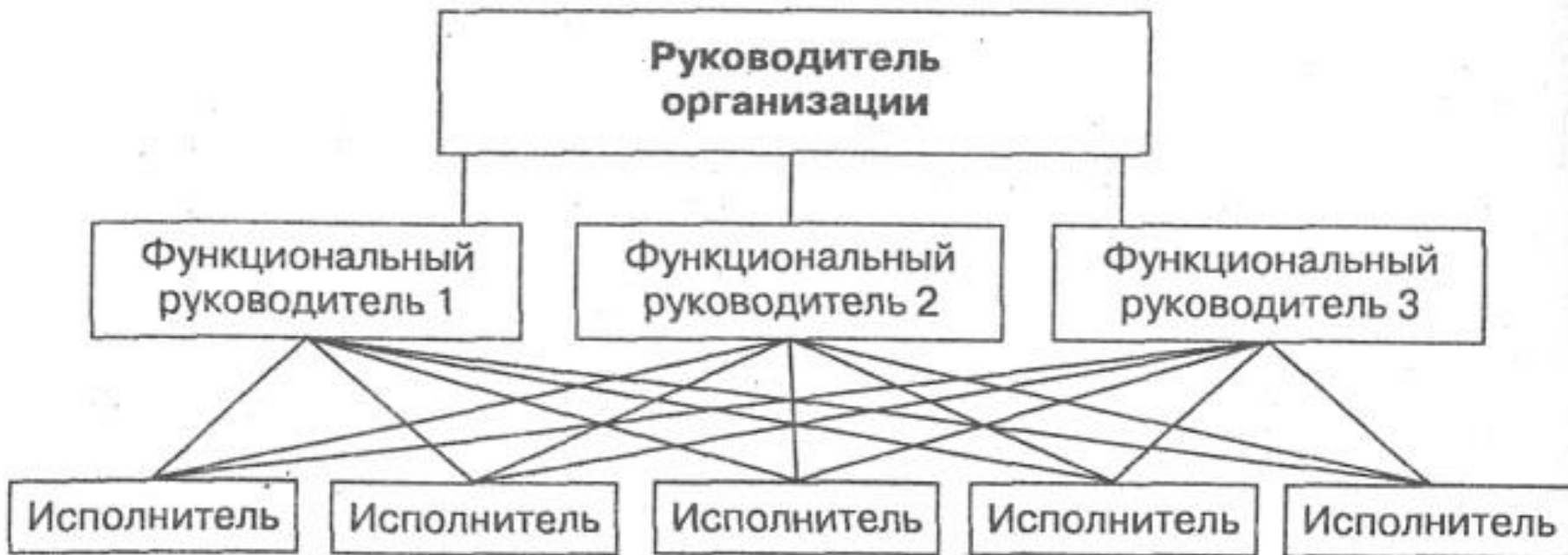
Рис. 2 Функциональная структура управления