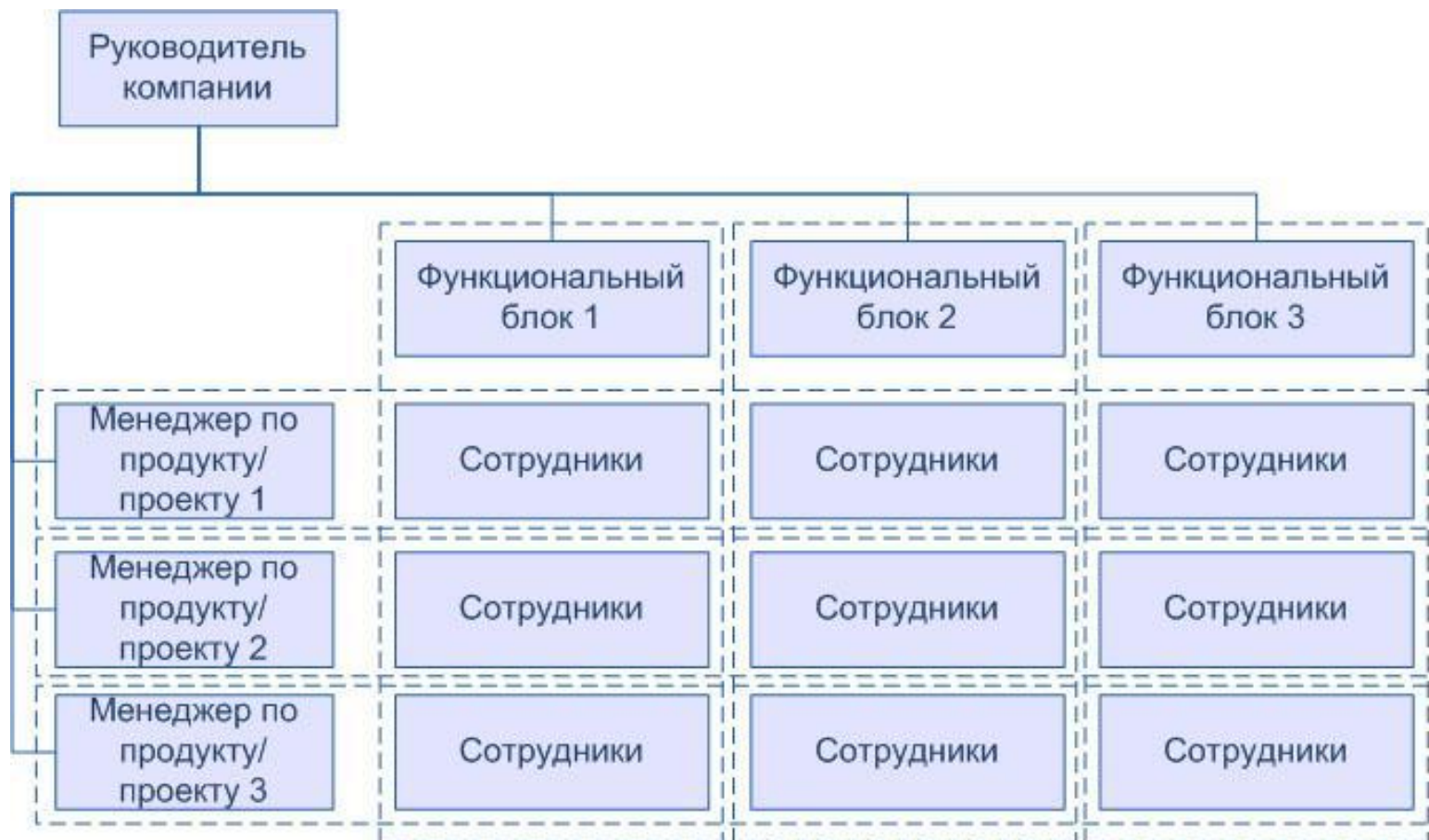
Рис. 5 Матричная структура управления