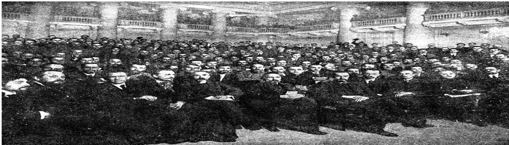
ПРЕДСТАВИТЕЛИ СОВѢТА РАБОЧИХЪ И СОЛДАТСКИХЪ ДЕПУТАТОВЪ. Среди нихъ: Г. В. Плехановъ, Н. С. Чхеидзе, М. И. Скобелевъ, И. Г. Церетелли, Богдановъ, Стекловъ и др.

Большевики для защиты своих позиций призвали население к формированию народных органов власти — Советов, они рассылали своих эмиссаров в самые глухие местечки белорусской территории. По рассказам жителей Петриковского района Гомельской области в 60-е годы автору данной статьи, представители большевиков, многие из которых были солдатами, уходившими с передовой по домам, останавливались в местечках и говорили о том, что царской власти пришел конец, надо самим брать власть в свои руки и управлять с пользой для народа. Поэтому повсеместно были созданы Советы рабочих и солдатских депутатов, а в сельской местности — Советы крестьянских депутатов, хотя и не очень четко представлявшие себе дальнейшие действия.