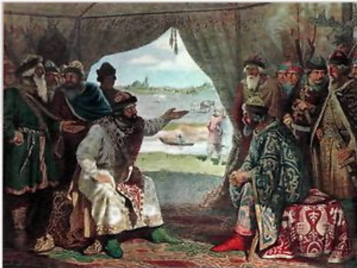
А.Д. Кившенко. «Долобский съезд князей - свидание князя Владимира Мономаха с князем Святополком».