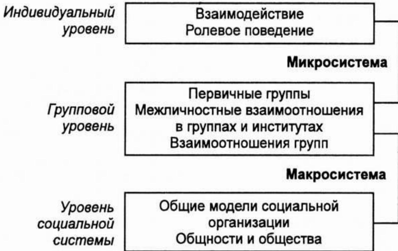
Рис. 1.3. Уровни социологического анализа