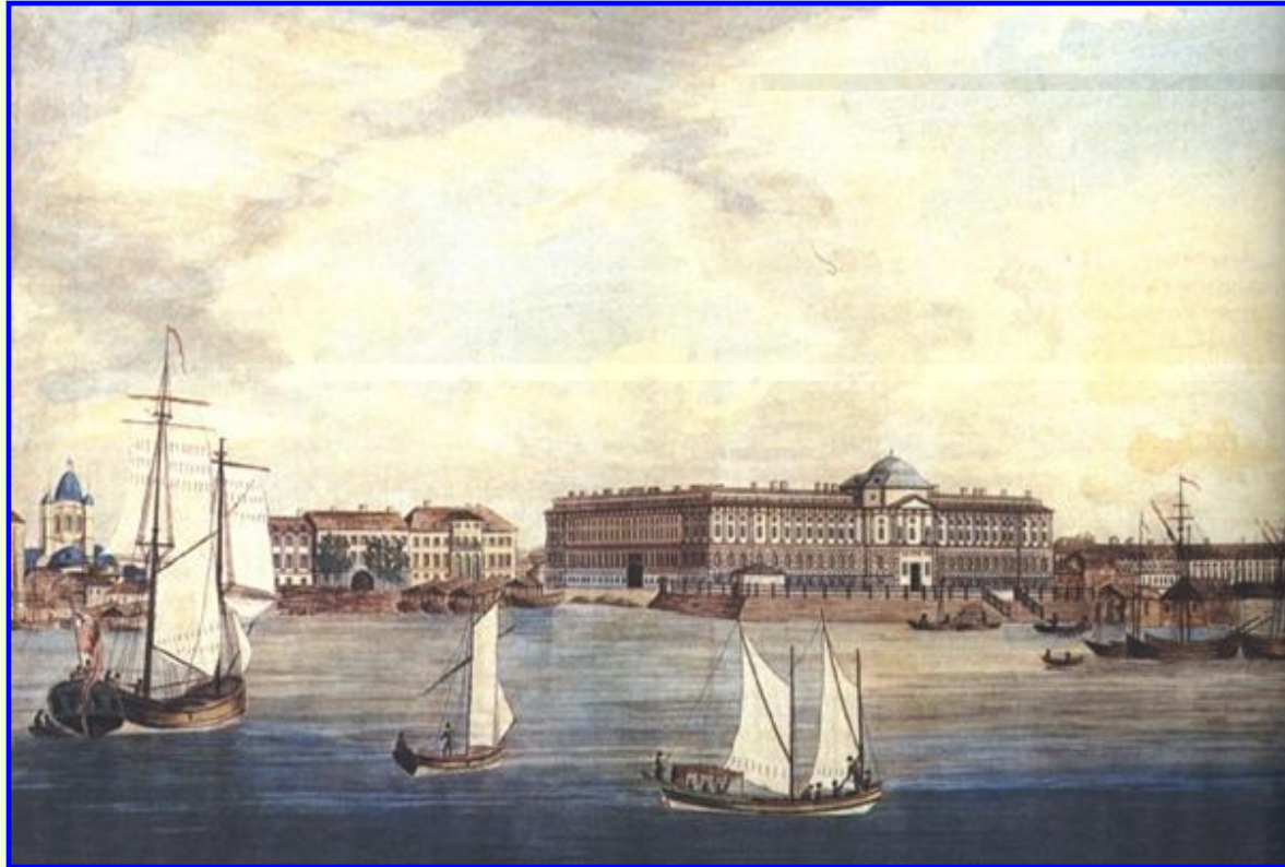
Санкт- Петербург в XVIII веке

В 1699 г. началась городская реформа. В Москве была создана Бурмистерская палата (позже переименована в Ратушу ), которой подчинялись земские избы городов.