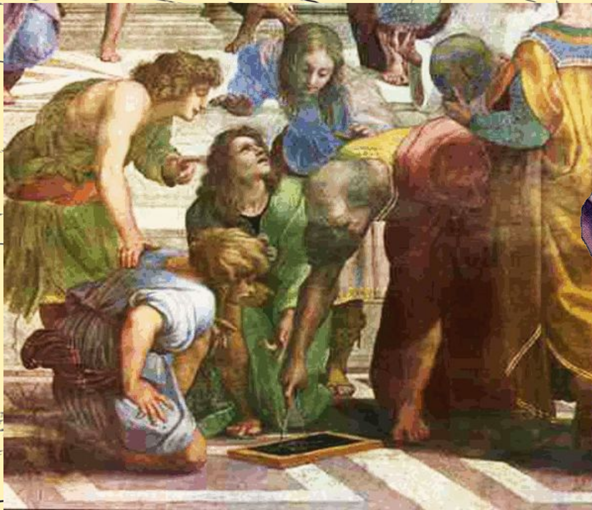
Пифагор с учениками