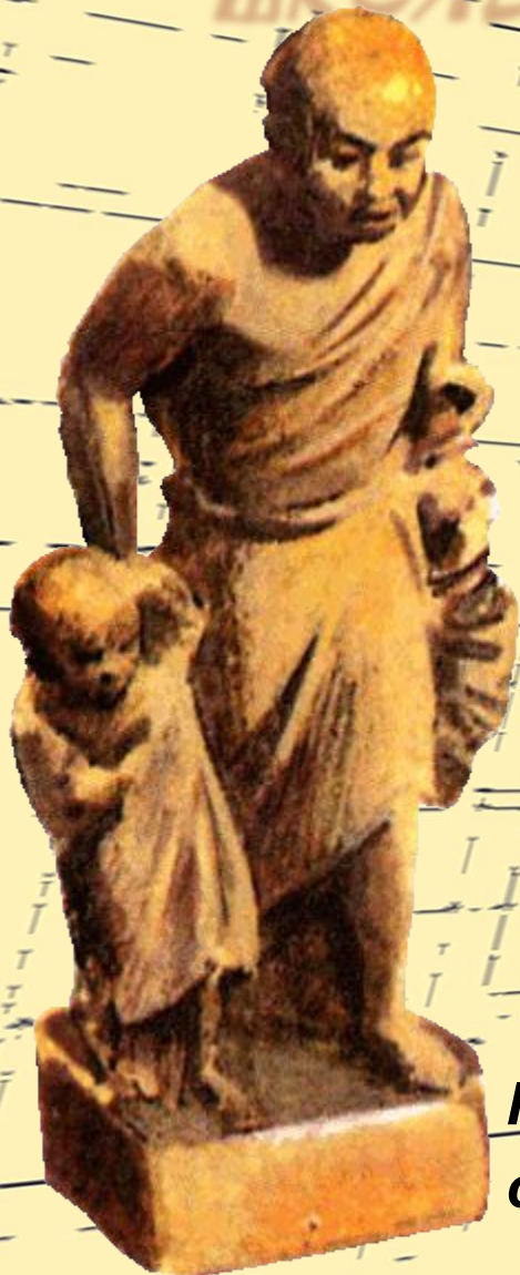
Педагог, сопровождающий ребёнка