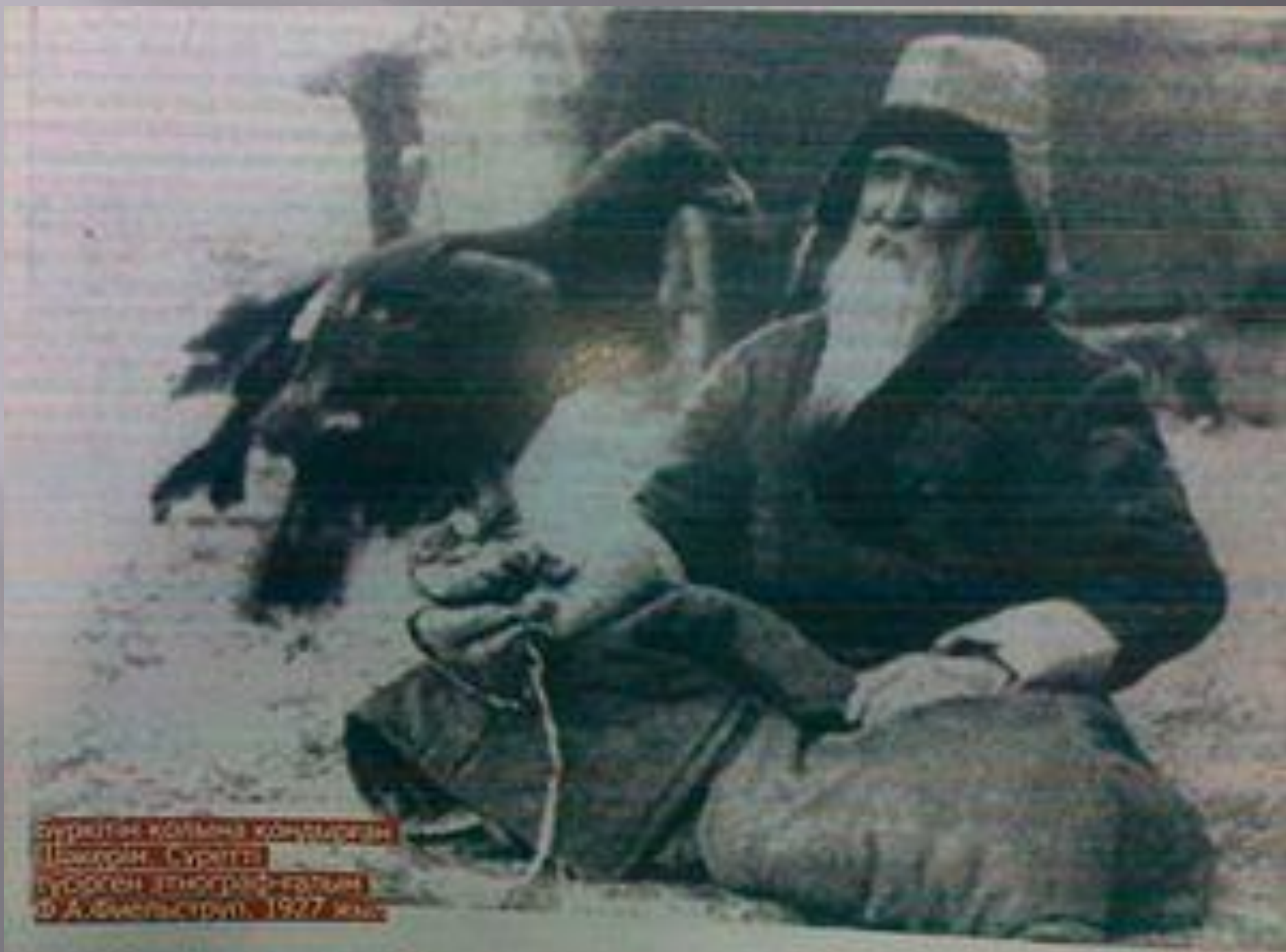
Супруги Волына восточнее Иркутск. Супруги выселились из Иркутска в А. Сибирский, 1927 г.