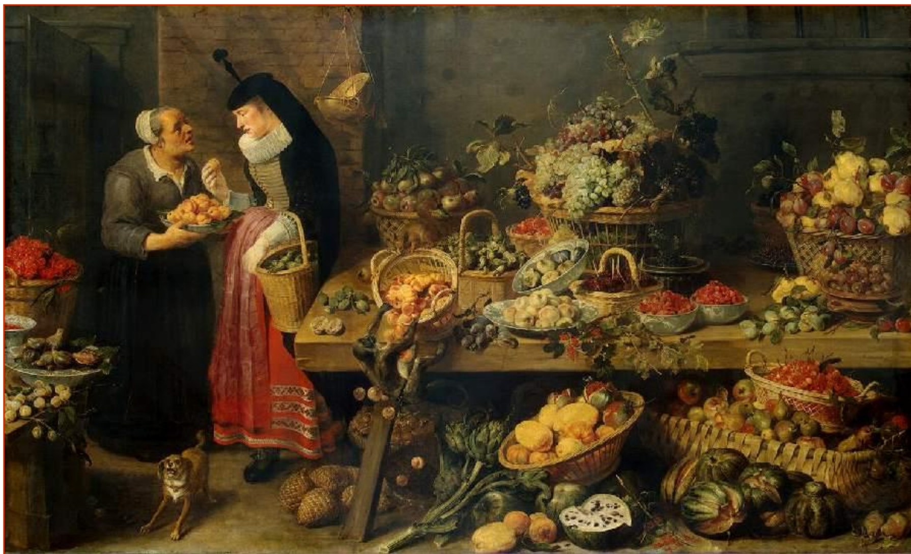
СНЕЙДЕРС Фруктовая лавка