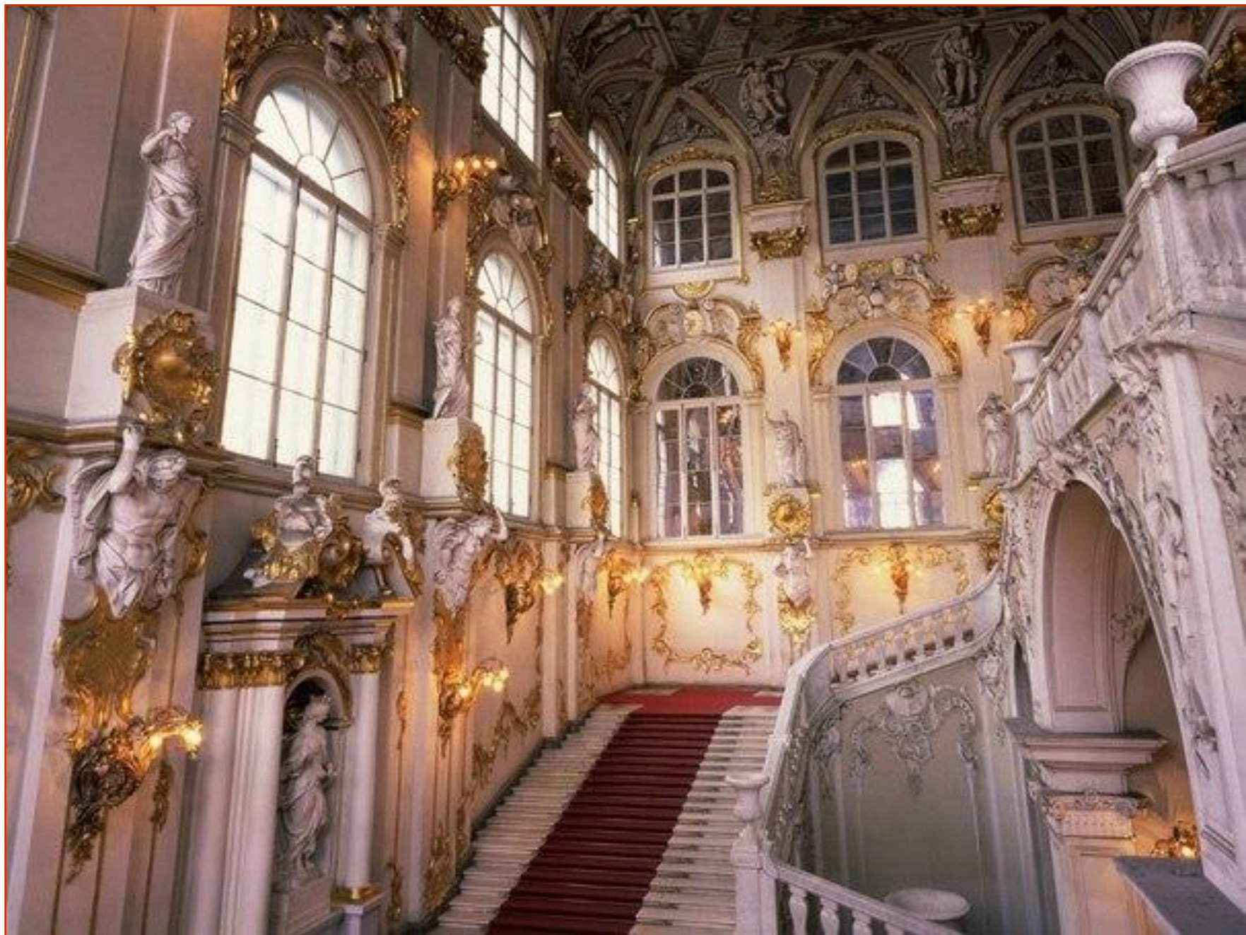
Эрмитаж. Парадная лестница ( гризайль )