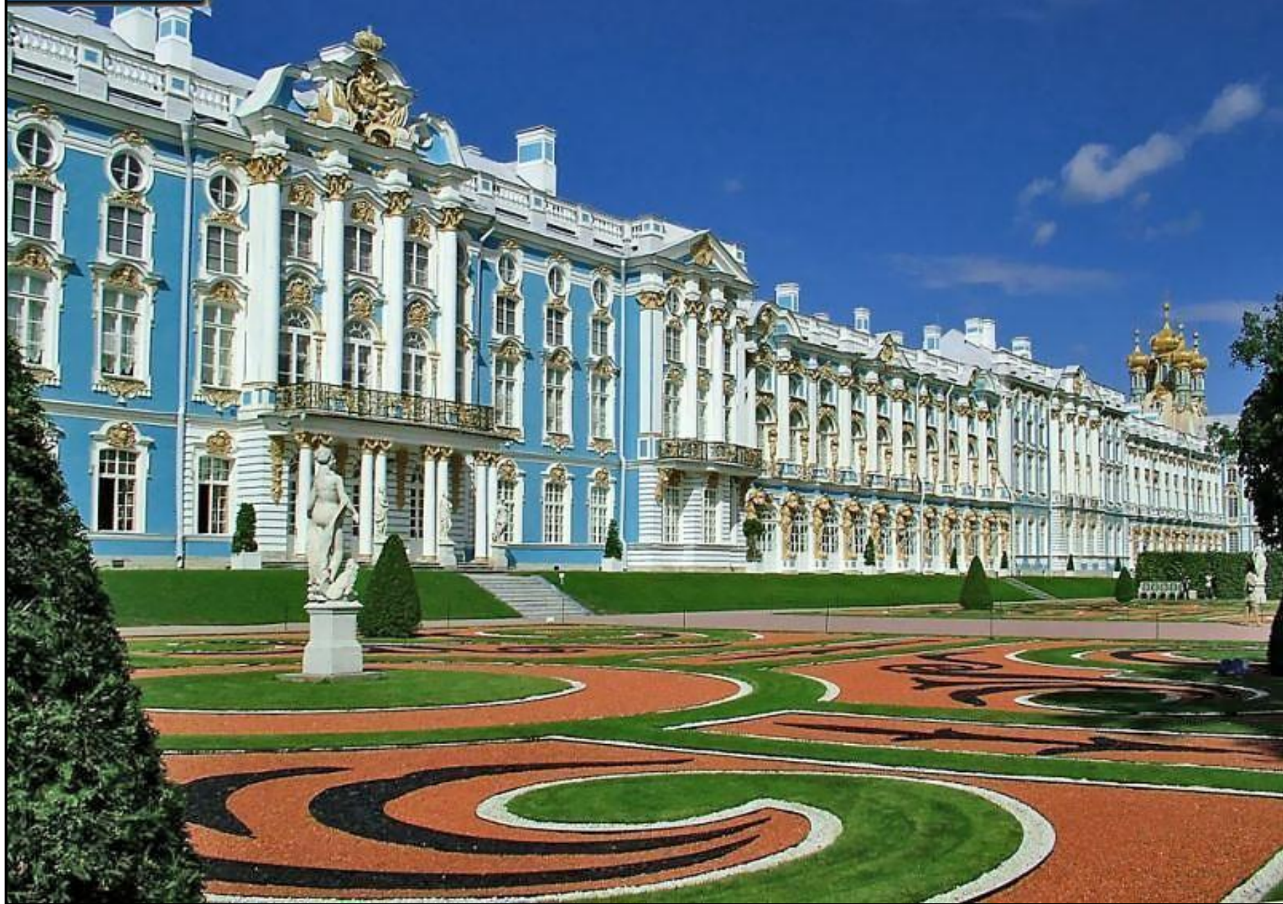
Б.Растрелли Екатерининский дворец