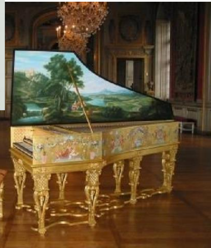
Антонио Вивальди (1678 – 1741)