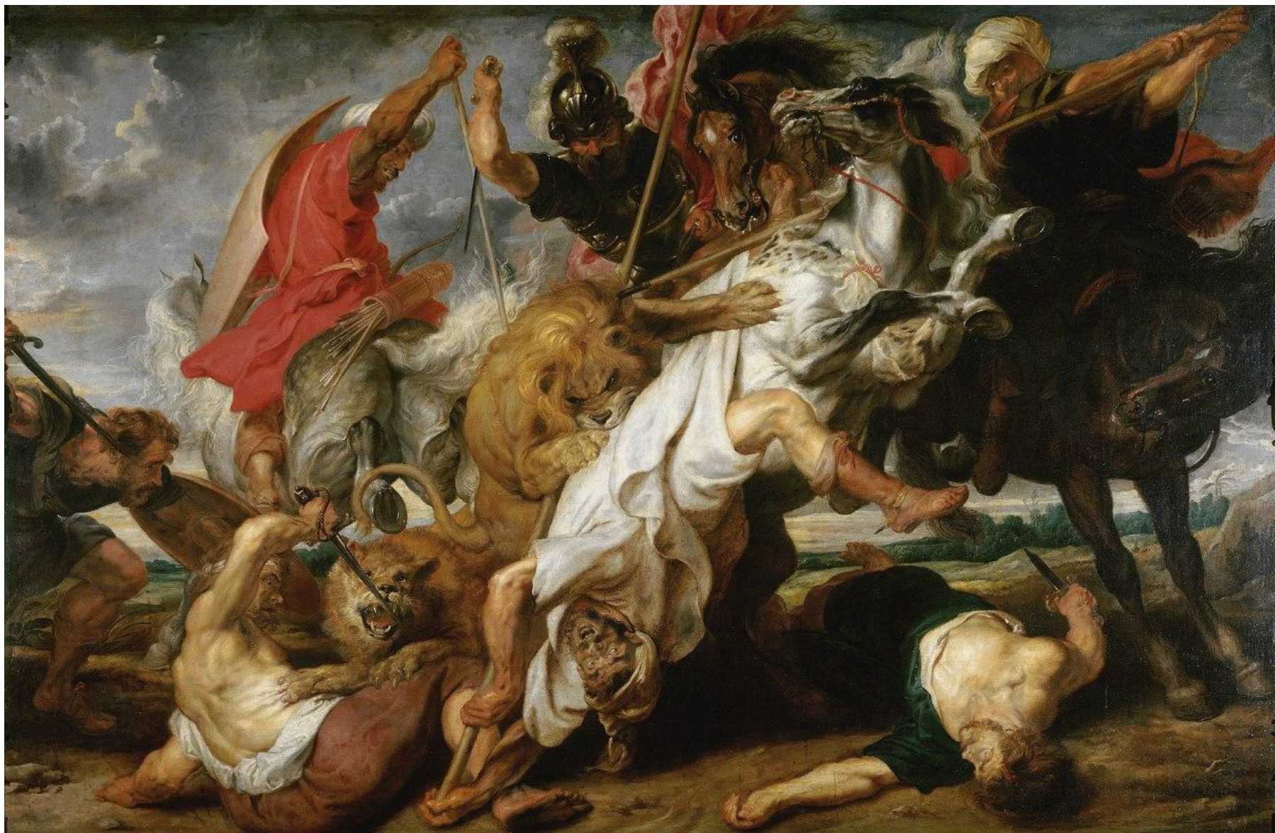
РУБЕНС Львиная охота