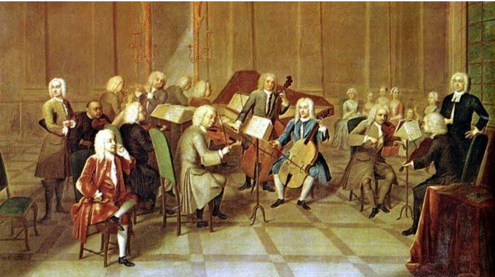
Оркестр времен Антонио Вивальди