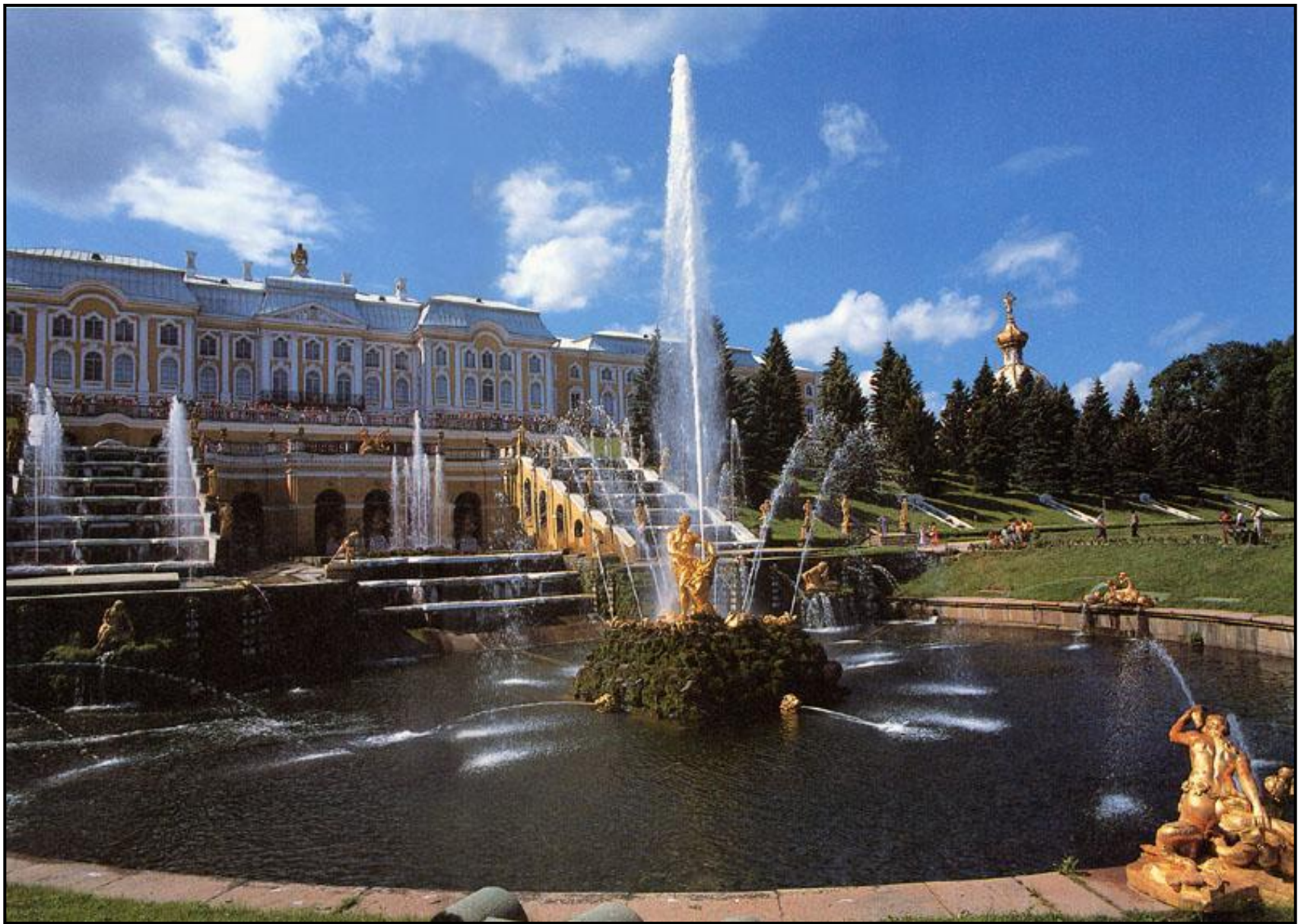
Б.РАСТРЕДЛИ Большой каскад в Петергофе. Россия.