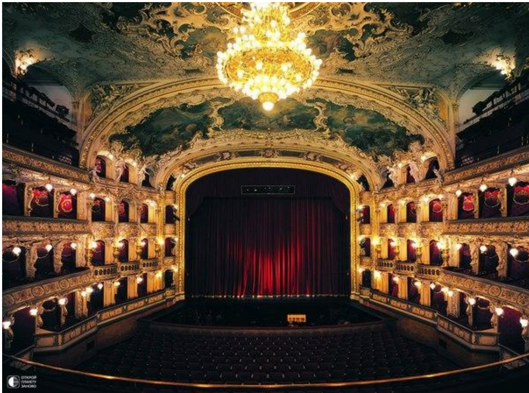
Интерьер сословного театра в Праге