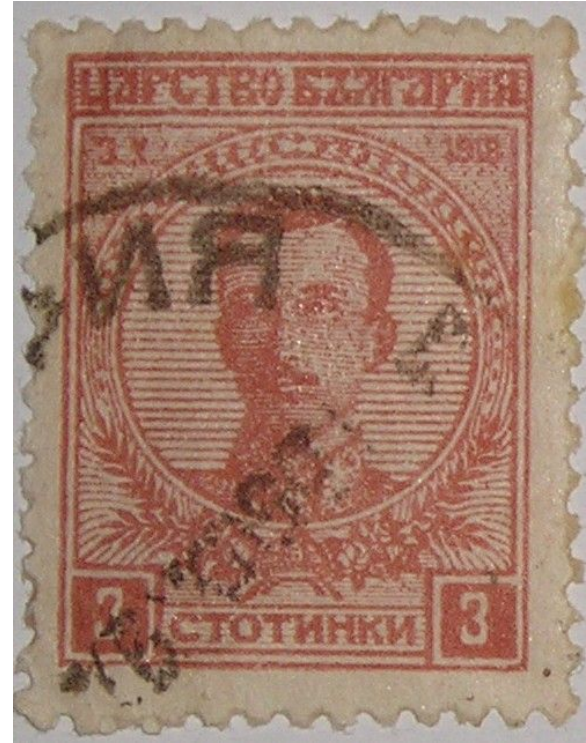
Болгарская почтовая марка, выпущенная в 1919 году к первой годовщине коронации Бориса III