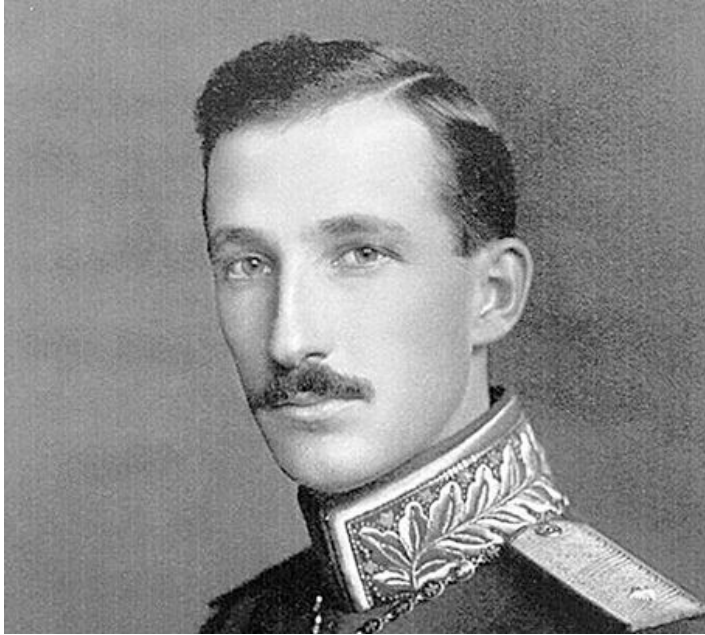
Царь Болгарии Борис III в 1919 году