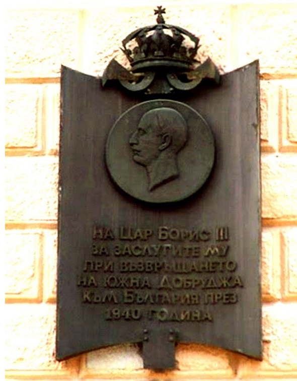
Город Добрич — пл. «Царь Борис III Объединитель» мемориальный барельеф Царя 1992