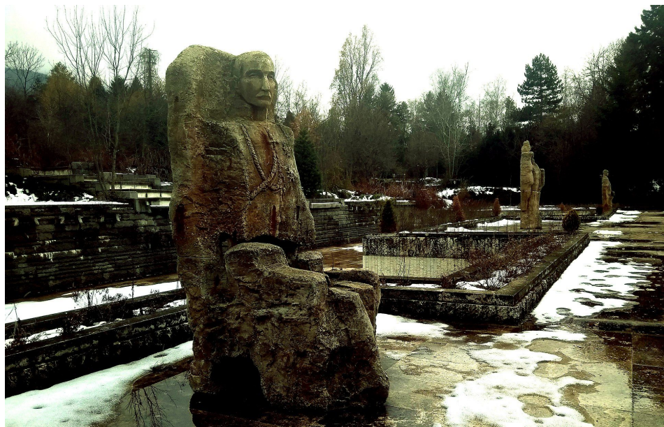
Царь Борис III болгарский — скульптор Куньо Новачев, архитектор Миломир Богданов, это первая созданная статуя Царя в натуральную величину.