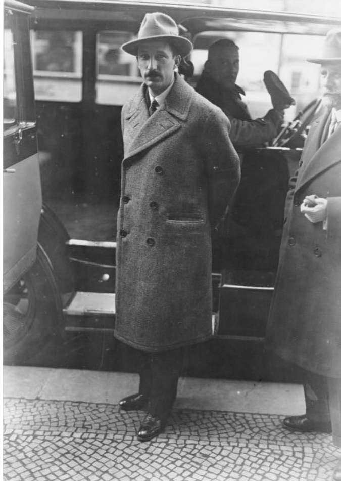
Борис III и Пауль фон Гинденбург, Берлин, 1929 г.