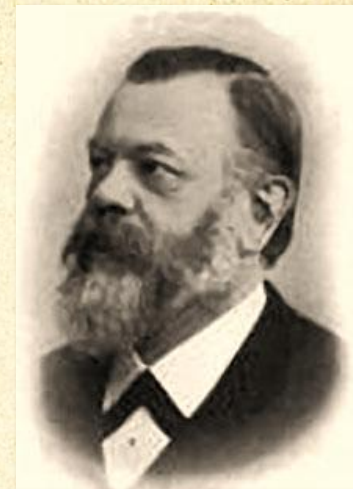
Карл Фёдорович Герман