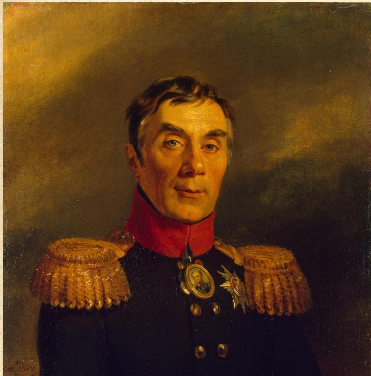
Алексей Андреевич Аракчеев

Начало 20-х гг. — отказ от проведения реформ.