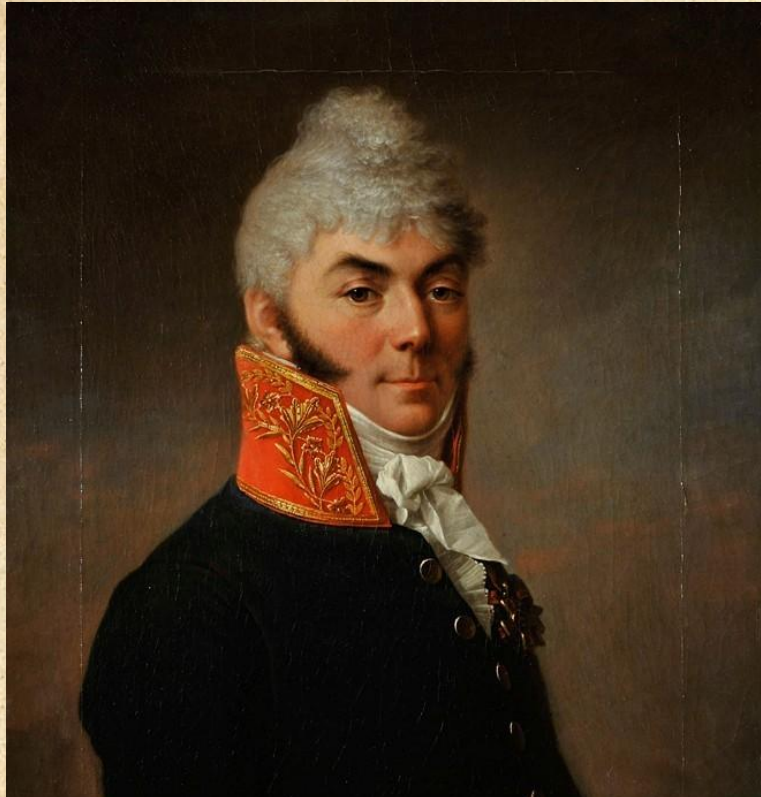
Николай Николаевич Новосильцев