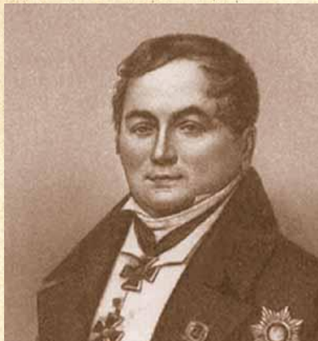
Михаил Андреевич Балугьянский

1821 г. — наступление на Петербургский университет.