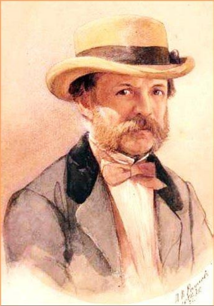
И. А. Гончаров

“Не опасаясь обвинения в преувеличении, - могу сказать по совести, что подобного произведения, как драмы, в нашей литературе не было. Она бесспорно занимает и, вероятно, долго будет занимать первое место по высоким классическим красотам”, - писал в своем кратком отзыве Гончаров.