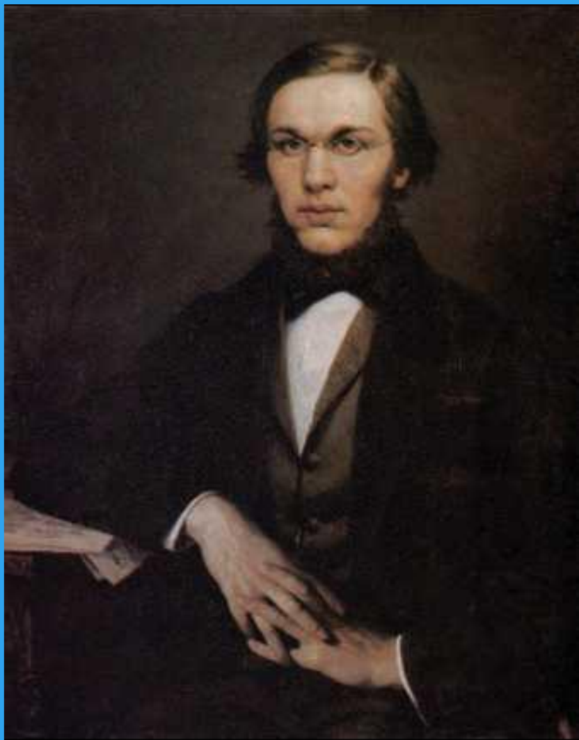
Н. А. Добролюбов

«Гроза» есть, без сомнения, самое решительное произведение Островского; взаимные отношения самодурства и безгласности доведены в ней до самых трагических последствий»