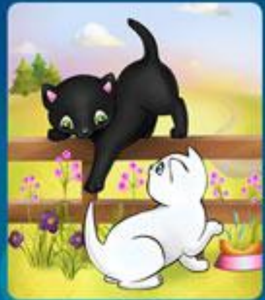
ЧЕРНЫЙ - БЕЛЫЙ