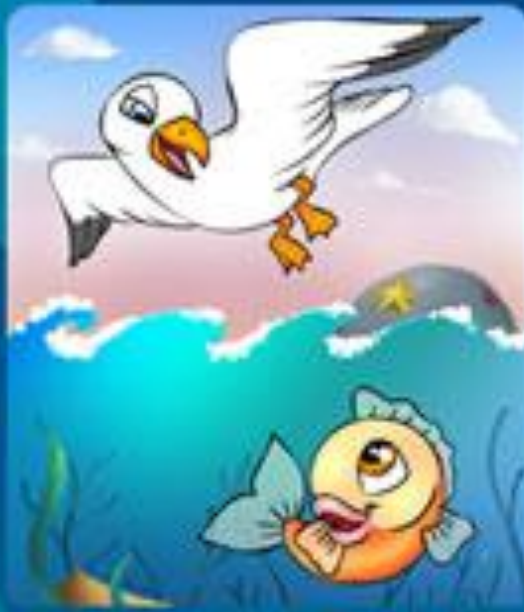
НАД - ПОД