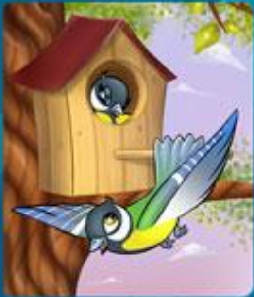
ВНУТРИ - СНАРУЖИ

Крошка сын к отцу пришел И спросила кроха: Бывает ли дешево и хорошо, Или дорого и плохо?