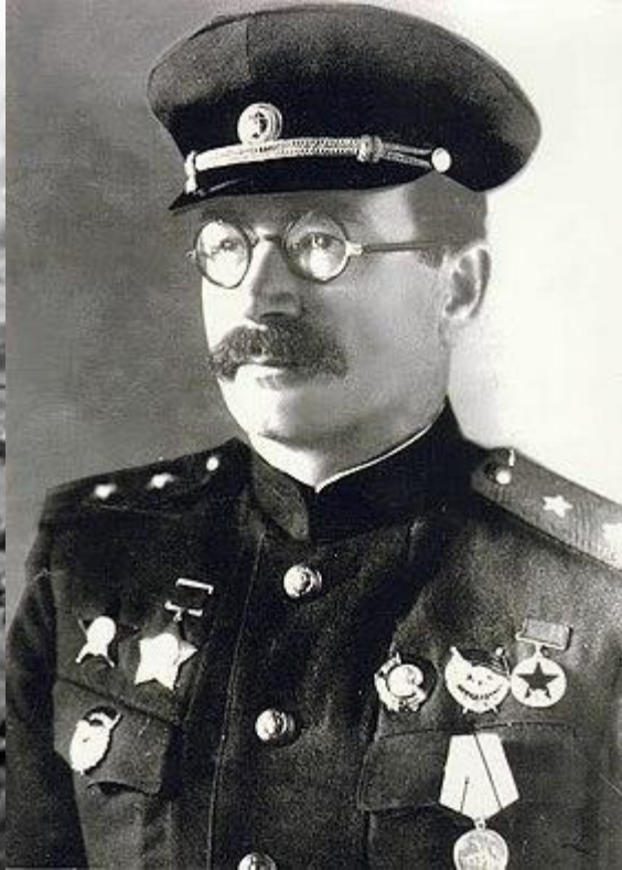
П. А. Ротмистров

Непосредственное командование танковыми соединениями во время сражения осуществлял: генерал-лейтенант Павел Ротмистров. Ни одной из сторон не удалось достичь целей, поставленных на 12 июля: германским войскам не удалось захватить Прохоровку, прорвать оборону советских войск и выйти на оперативный простор, а советским войскам не удалось окружить группировку противника.