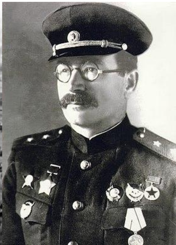
П. А. Ротмистров

Непосредственное командование танковыми соединениями во время сражения осуществлял: генерал-лейтенант Павел Ротмистров. Ни одной из сторон не удалось достичь целей, поставленных на 12 июля: германским войскам не удалось захватить Прохоровку, прорвать оборону советских войск и выйти на оперативный простор, а советским войскам не удалось окружить группировку противника.