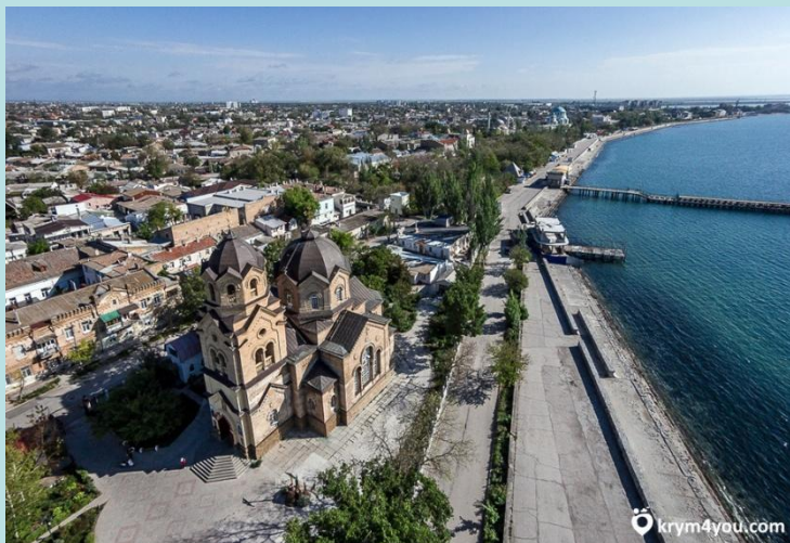
Церковь святого Ильи