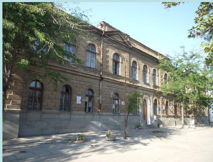
Гимназия им. Сельвинского