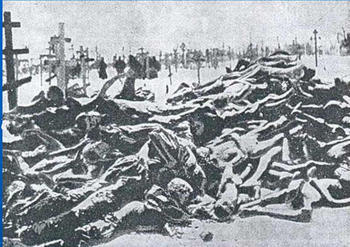
Кладовище в Харкові. Замерзлі трупи українських селян померлих з голоду. 1933 р.

Демографічні втрати від Голодомору 1932–1933 років в Україні становлять 3 мільйони 238 тисяч людей. Або, беручи до уваги неточність статистики, цифри діапазоні від 3 до 3,5 мільйонів людей.