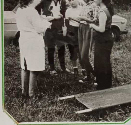
В походе летом 19