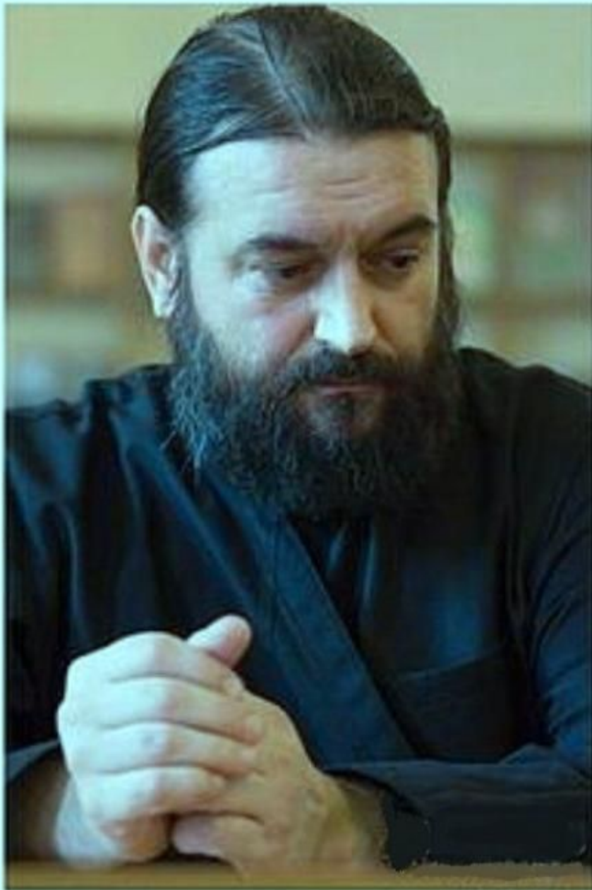
Протоиерей Андрей Ткачѐв

«Пост помогает меняться. По крайней мере, дает надежду на перемены. Многие говорят: Принимайте меня таким, как я есть. Но это ложь! Человек не должен быть таким, каким он есть. Он должен быть лучше. Он обязан быть лучше. И он обязан хотеть быть лучше. Пост дает человеку возможность стать лучше, если он этого хочет.»