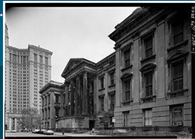
Одно трёхэтажное здание нью-йоркского окружного суда стоило дороже, чем вся Аляска