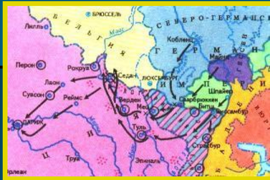
Карта франко-прусской войны