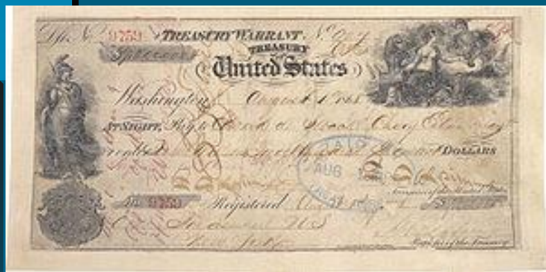
Чек, использовавшийся для покупки Аляски