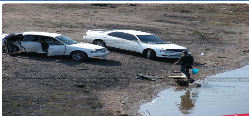
Мойка машин у реки. Загрязнение окружающей среды