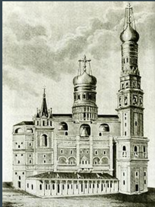
Вид колокольни и звонницы (1805) до взрыва французами

С крестом колокольни Ивана Великого связана доньне бытующая кладоискательская легенда, основанная на ошибках в мемуарах участников французского вторжения в Россию, повествующая о вывозе святыни из Москвы и последующем затоплении в одном из озёр по пути отступления. Обломки креста были обнаружены 5 марта 1813 года синодальным ризничим иеромонахом Зосимой под талым снегом около Успенского собора, о чём и доложил обер-прокурору правительствующего Синода князю А. Н. Голицыну 10 марта 1813 года московский архиепископ Августин (Виноградский). Опровержение сообщений о вывозе креста из столицы за подписью «Кремлёвский житель», исходившее от «почтенной духовной особы», было опубликовано в № 1 «Вестника Европы» за 1813 год.