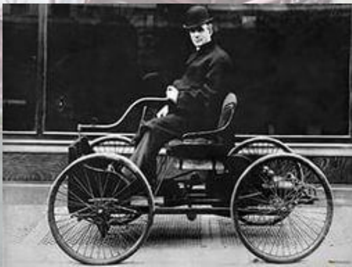
«Форд» 1908 г.