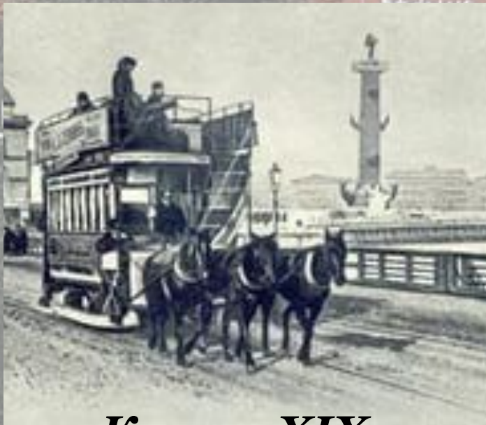
Конка XIX в.