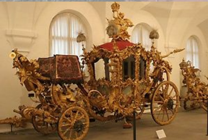
Карета XV в.