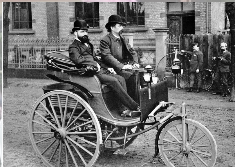
«Motorwagen» Карла Бенца 1886 г.