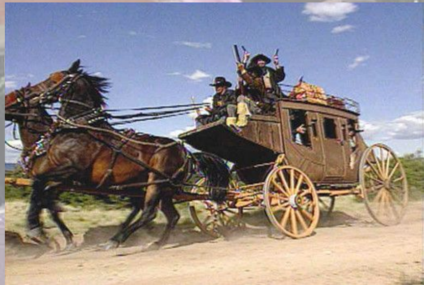
Дилижанс XVIII в.