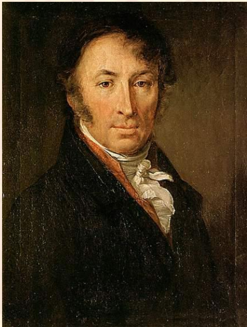
Портрет работы В.А. Тропинина