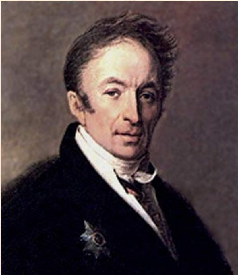
Н.М.Карамзин. Худ. А.Г.Венецианов. 1828