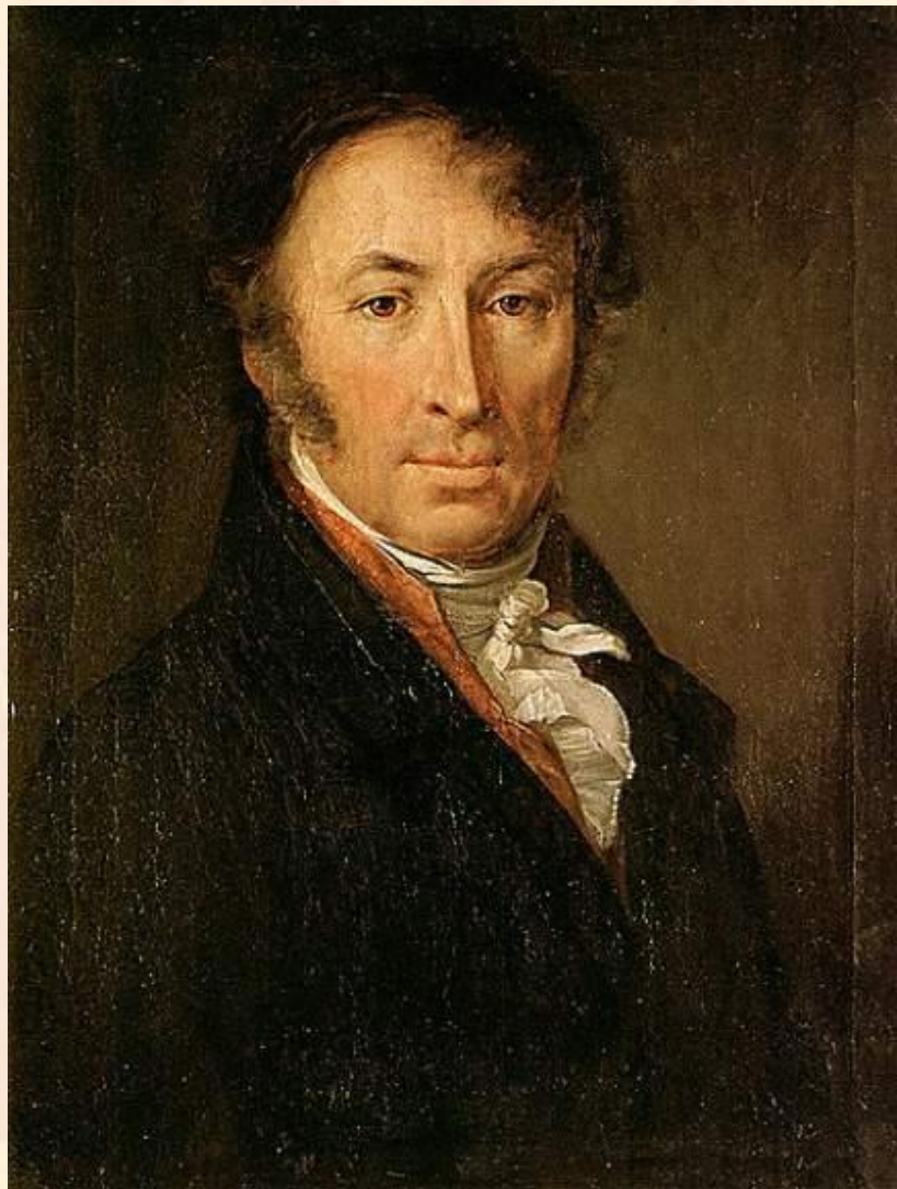
Портрет работы В.А. Тропинина