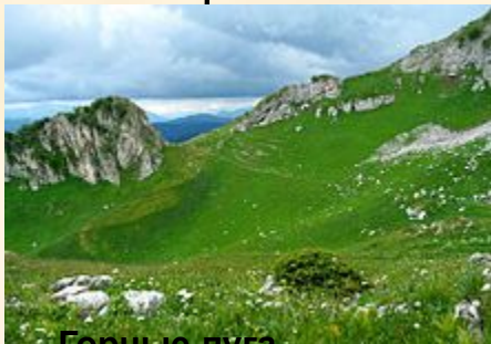
Горные луга, Апшеронский район