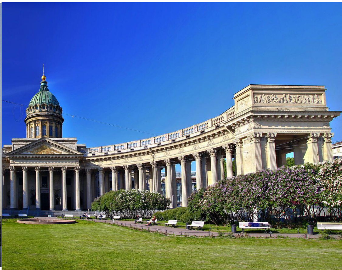
А. Воронихин. Казанский собор.