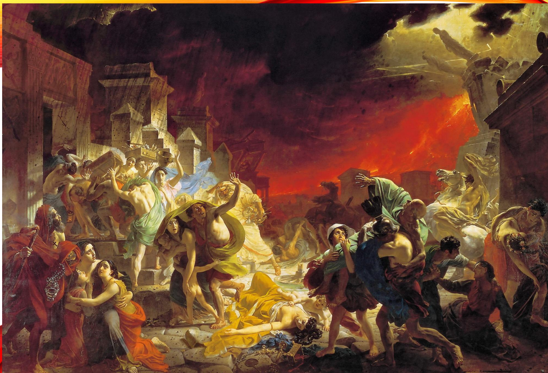
Карл Брюллов. Последний день Помпеи.