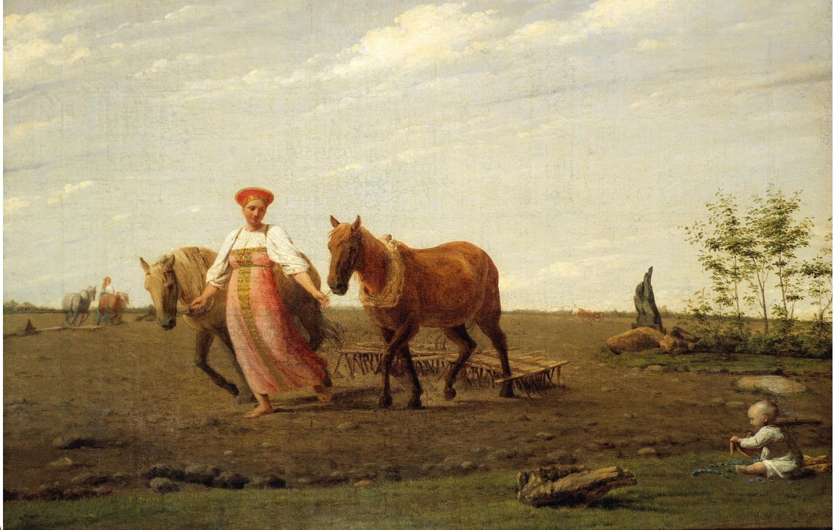
Венецианов А.Г. На пашне. Весна.