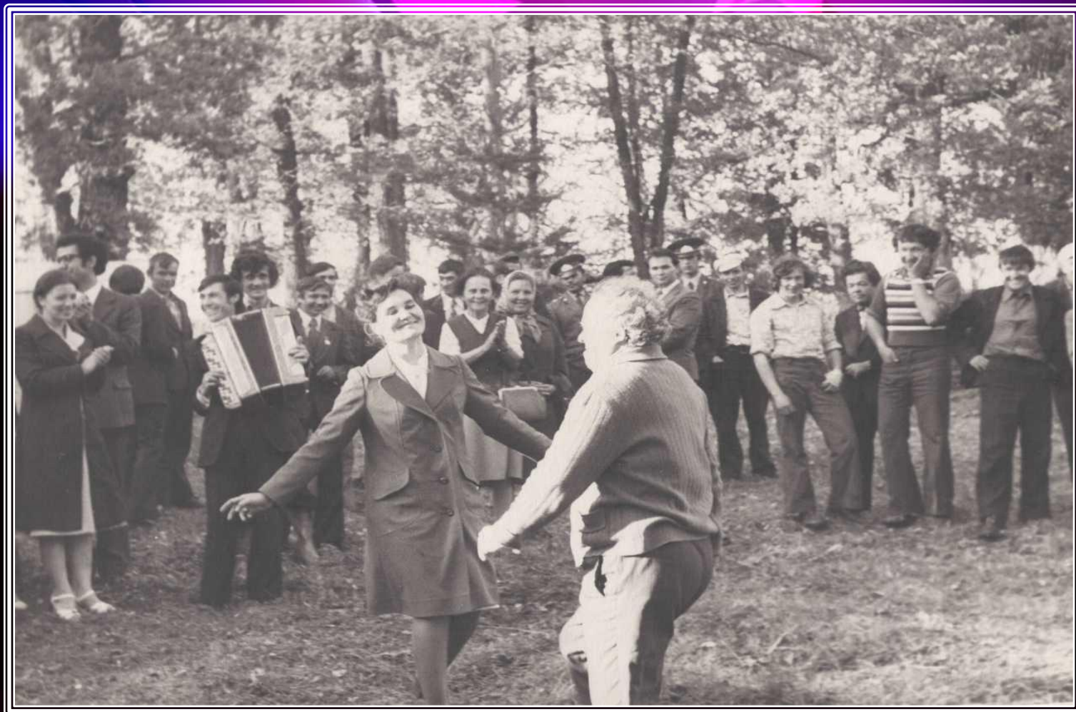
Республиканың атказанган балетмейстеры Котдус Хесәенов