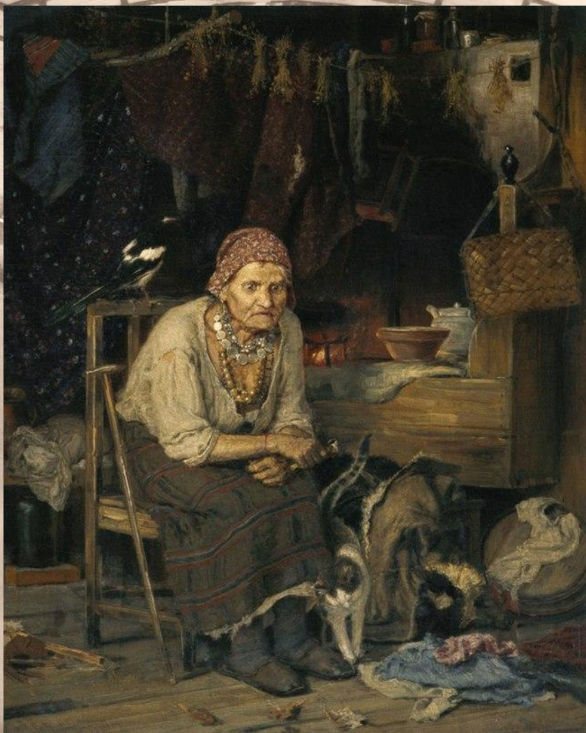
С нечистым знается, 1879, Третьяковская галерея