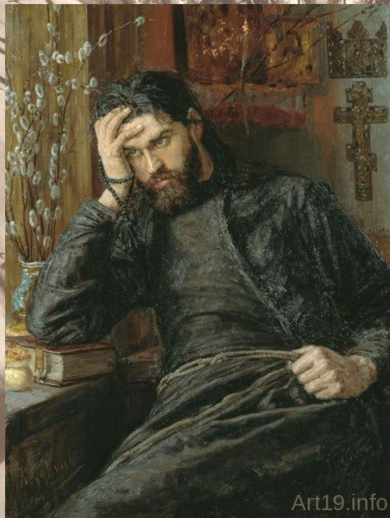
Инок. 1897 год