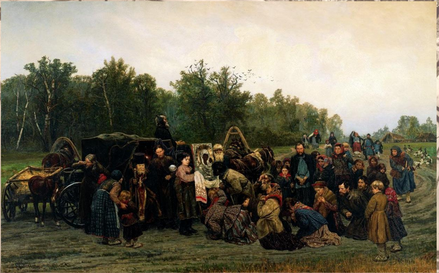
Встреча иконы 1878, Третьяковская галерея