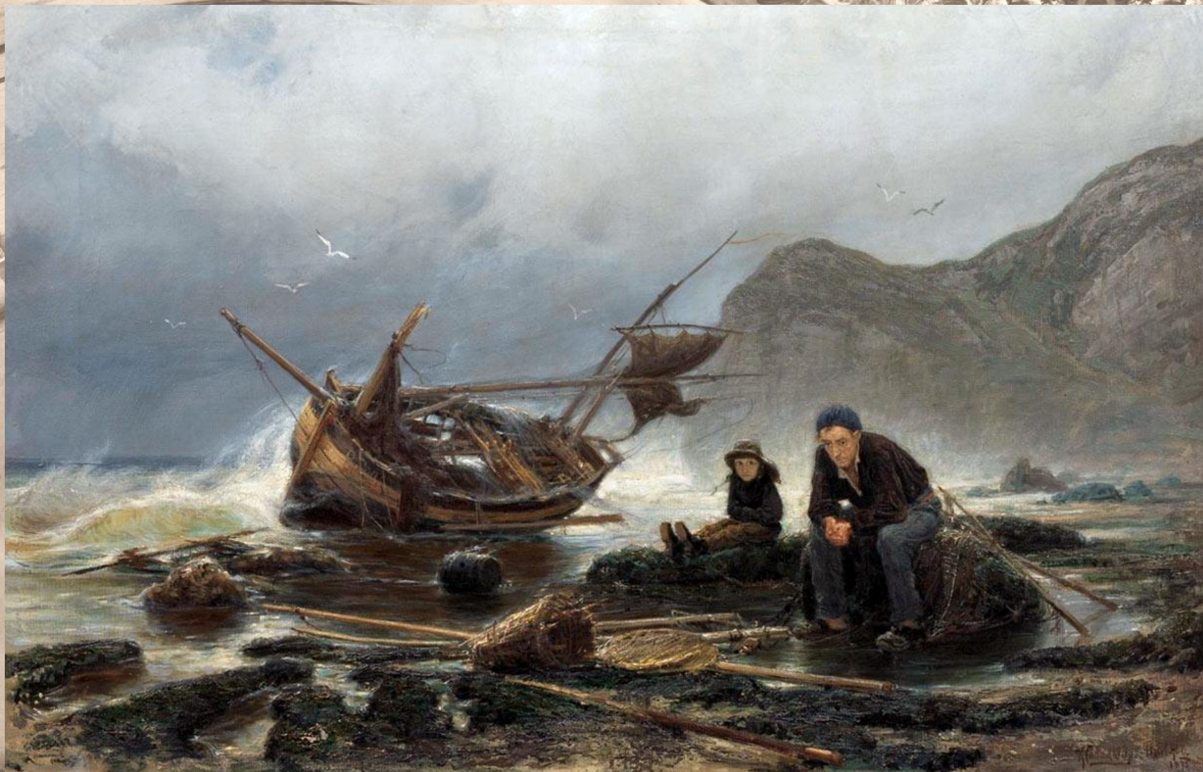
Море в Нормандии. 1875 год