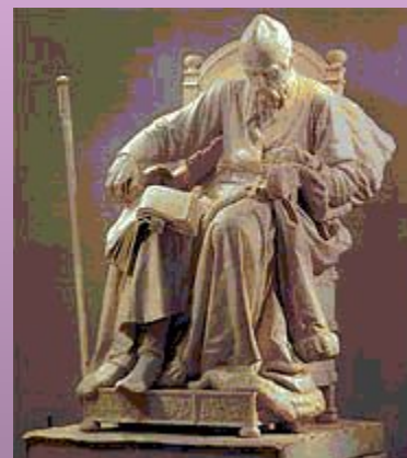
М.М.Антокольский. «Царь Иоанн Васильевич Грозный». Мрамор 1875 г.