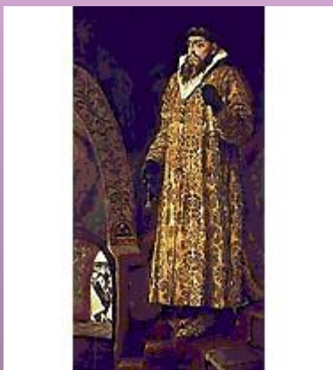
В.М.Васнецов. «Царь Иван Васильевич Грозный». 1897 г.