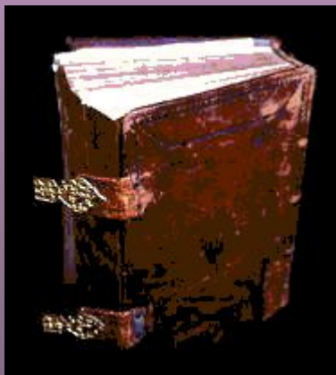
Сборник решений Стоглавого собора 1551 г.