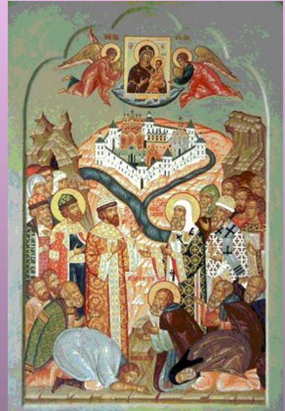
Икона «Встреча Ивана Грозного с митрополитом Макарием»