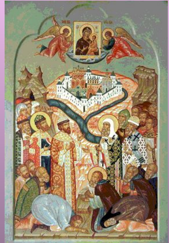
Икона «Встреча Ивана Грозного с митрополитом Макарием»