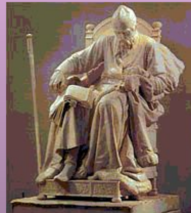
М.М.Антокольский. «Царь Иоанн Васильевич Грозный». Мрамор 1875 г.