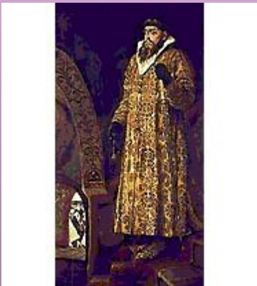
В.М.Васнецов. «Царь Иван Васильевич Грозный». 1897 г.