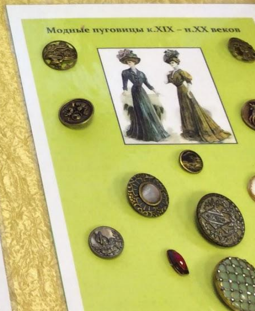
Модные пуговицы к XIX - н. XX веков