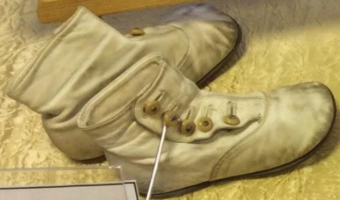
Крючки для застегивания пуговиц на перчатках и ботинках XIX - XX века