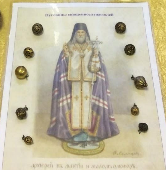
архиеп. Ис. Анаст. и митроп. Ис. Вологодск.