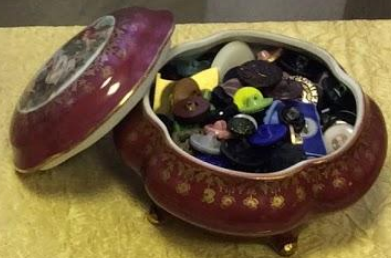
Шкатулка с винтажными пуговицами 40-80е годы XX века