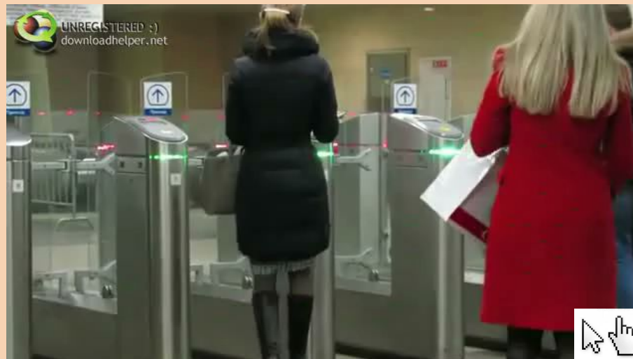
Светов ой датчик