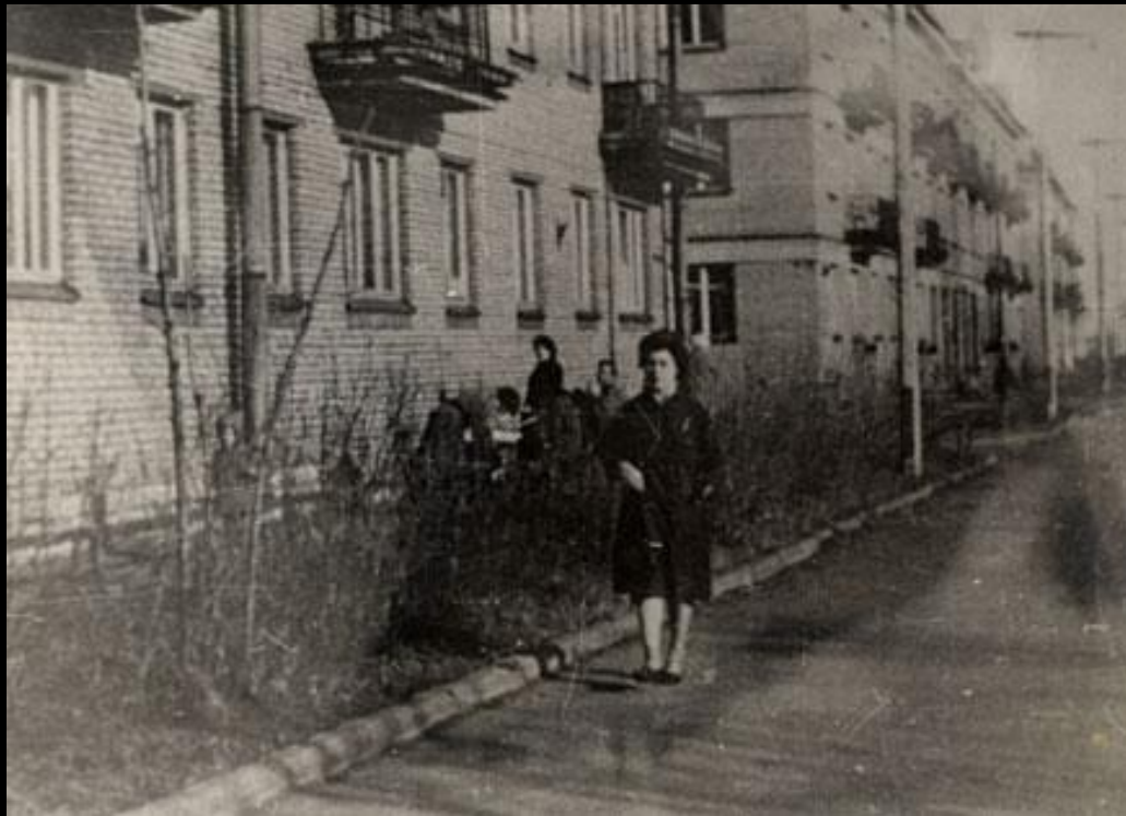
Кадры из фильма «Вслед за плывущими облаками»