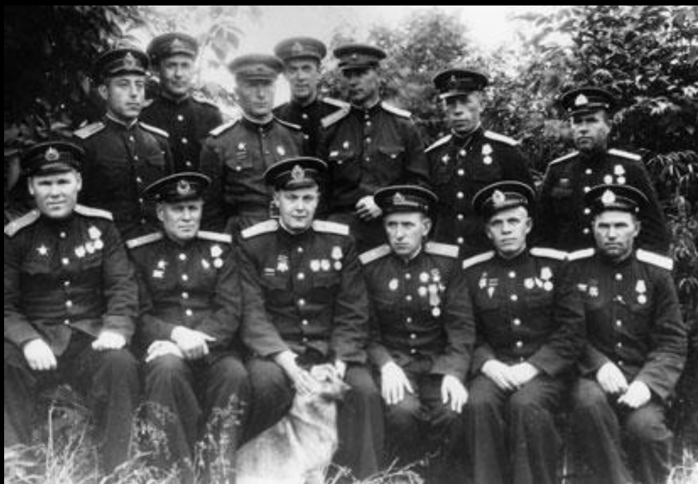
Кольберг 1944 год