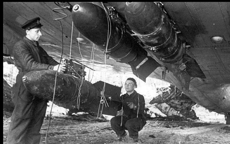
Аэродром «Гражданка» 1941 год